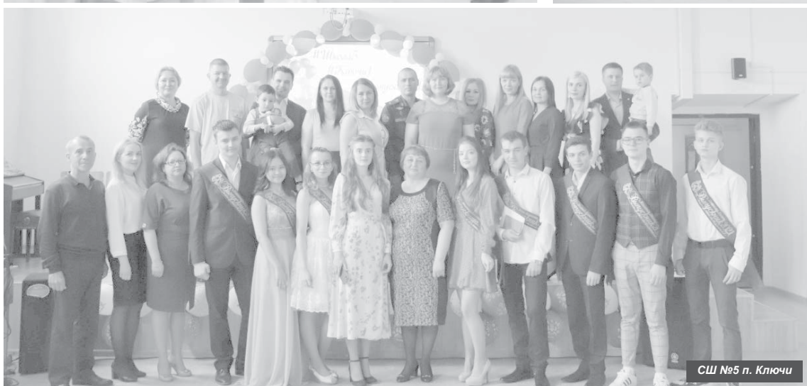
СШ №5 п. Ключи