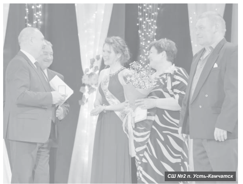
СШ №2 п. Усть-Камчатск