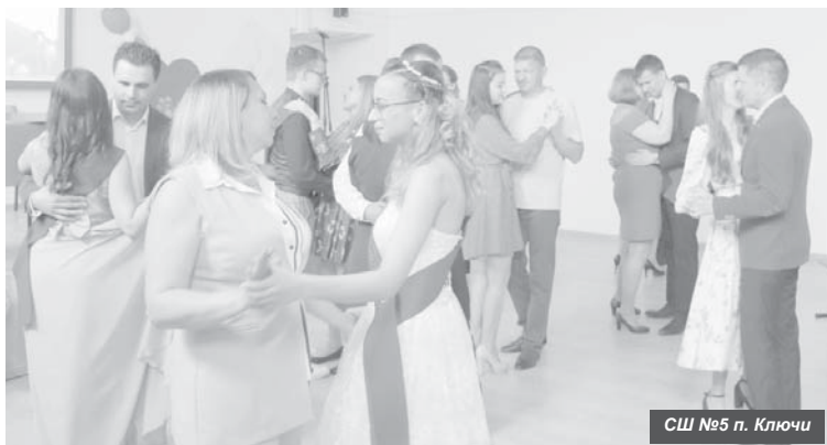
СШ №5 п. Ключи