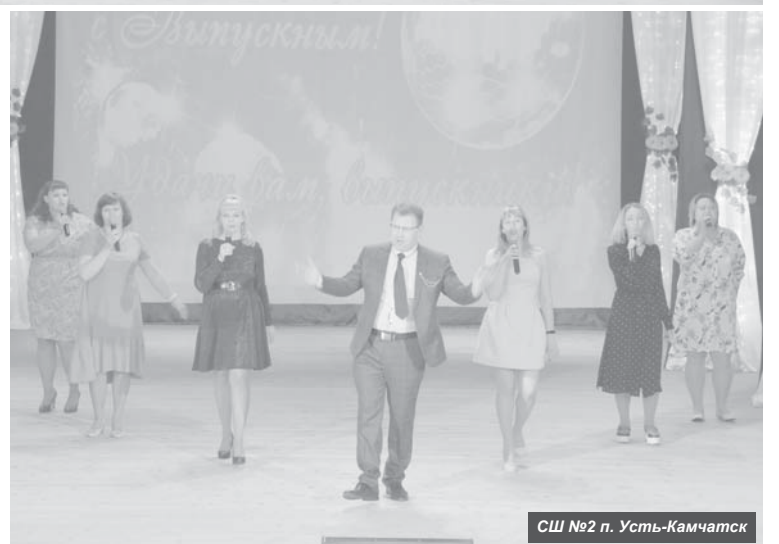
СШ №2 п. Усть-Камчатск