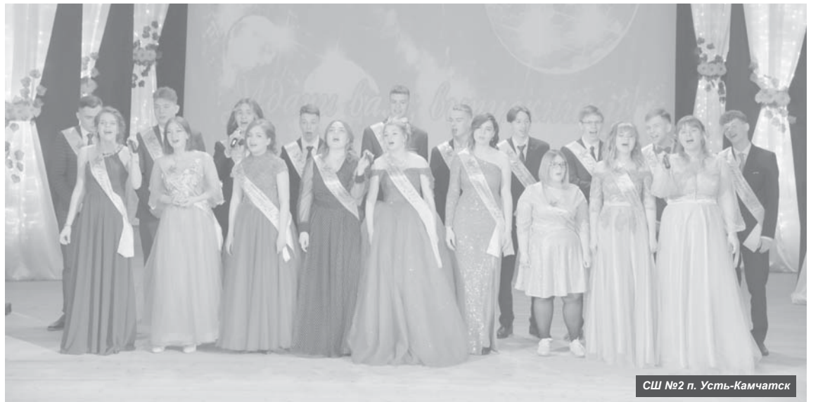
СШ №2 п. Усть-Камчатск