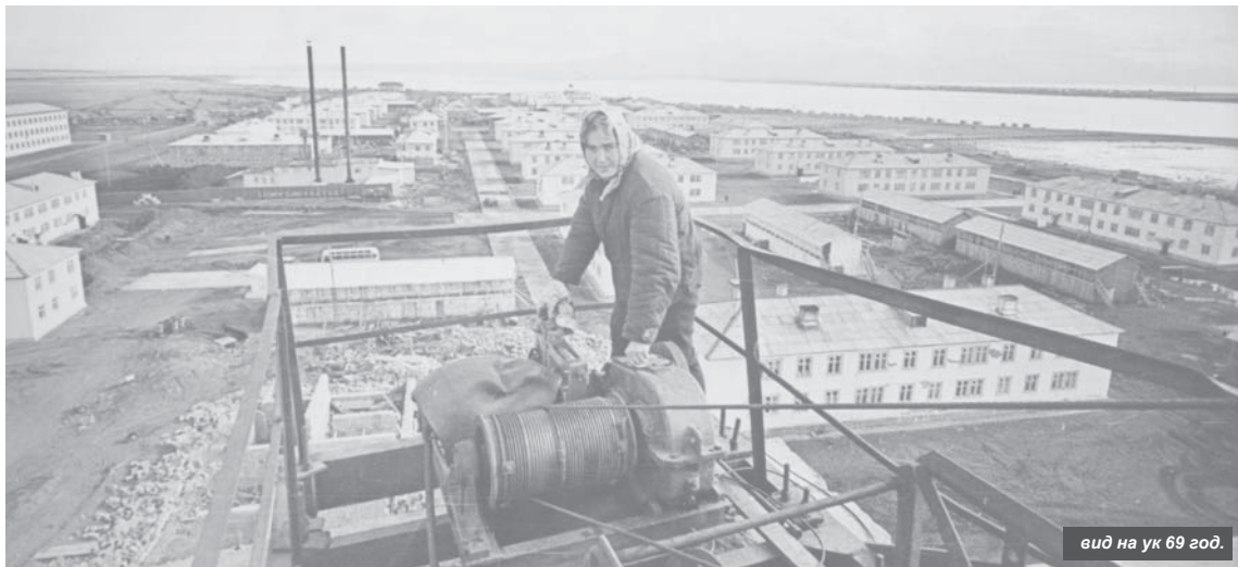
вид на ул 69 год.

А вы знали, что в Усть-Камчатске нет площади Ленина и парка «Юбилейного»? Объекты имеют совсем другие названия. Какие? Рассказал Виктор Борисов в своём материале.