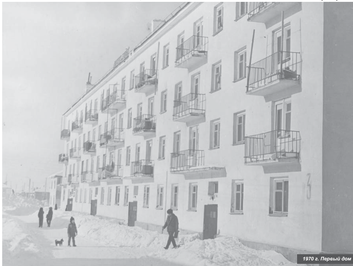
1970 г. Первый дом