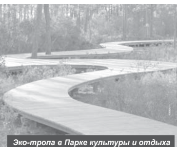
Эко-тропа в Парке культуры и отдыха

Мероприятия будут реализованы в рамках национального проекта «Жильё и городская среда» по программе «Формирование комфортной городской среды».