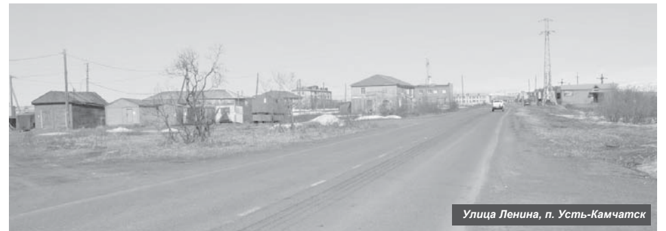
Улица Ленина, п. Усть-Камчатск