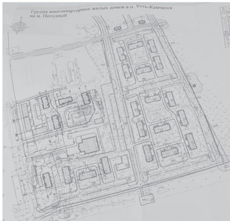
Группа многоквартирных жилых домов в п. Усть-Камчатск на м. Погодный

Два пятиэтажных 30-квартирных дома зарегистрированы в Министерстве строительства РФ и внесены в соответствующий реестр по программе расселения из аварийного жилищного фонда. В нём они значатся как типовые.