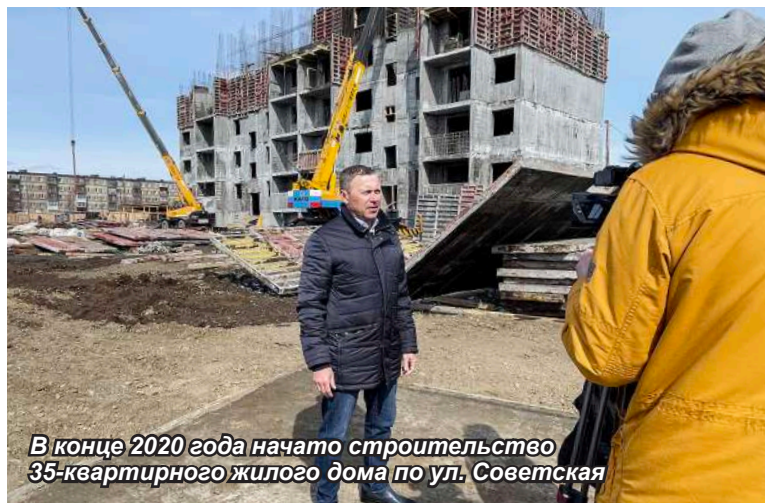
В конце 2020 года начато строительство 35-квартирного жилого дома по ул. Советская

ятий в рамках муниципальной программы «Социальная поддержка граждан Мильковского муниципального района на 2018-2023 годы» в 2020 году исполнена на 99,7%. В связи с тяжёлой эпидемиологической ситуацией, связанной с распространением коронавирусной инфекции, 527 гражданам в возрасте 65+, оказавшимся в трудной жизненной ситуации, проживающим в Мильковском районе, оказана адресная помощь в виде предоставления продуктовых наборов.