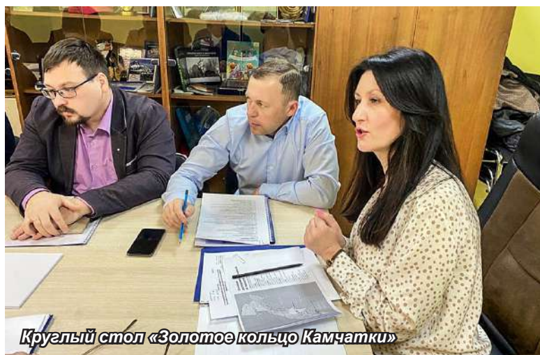
Круглый стол «Золотое кольцо Камчатки»