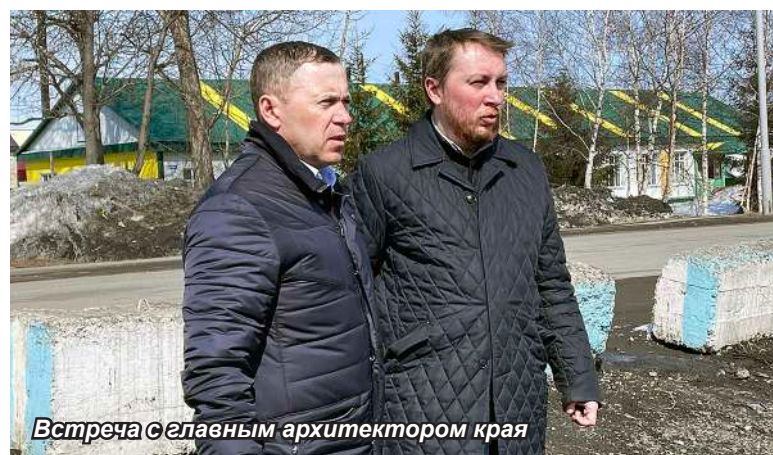
Встреча с главным архитектором края