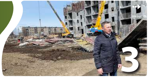
Отчёт главы района