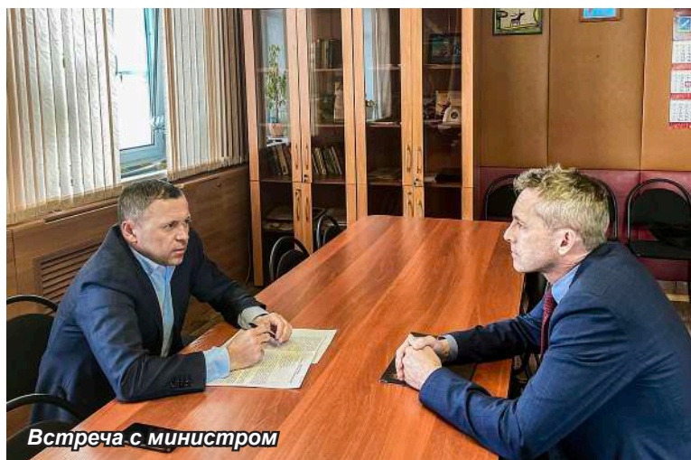
Встреча с министром

В наше очень непростое время мы обязаны делать всё возможное для людей, оказавшихся по разным причинам в сложной жизненной ситуации. В 2020 году проведено 19 заседаний Комиссии по социальной поддержке населения Мильковского муниципального района, на которых рассмотрено 488 заявлений. Обращения граждан связаны с оказанием материальной помощи на одежду, обувь, продукты питания, приобретение бытовой техники, лекарственные препараты, косметический ремонт квартир и др. Реализация меропри-