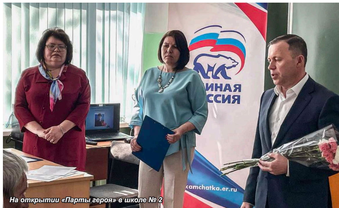
На открытии «Парты героя» в школе № 2

Для выработки и подготовки консолидированных решений по совместным вопросам ведения депутатам предложено войти во все профильные комиссии администрации района.