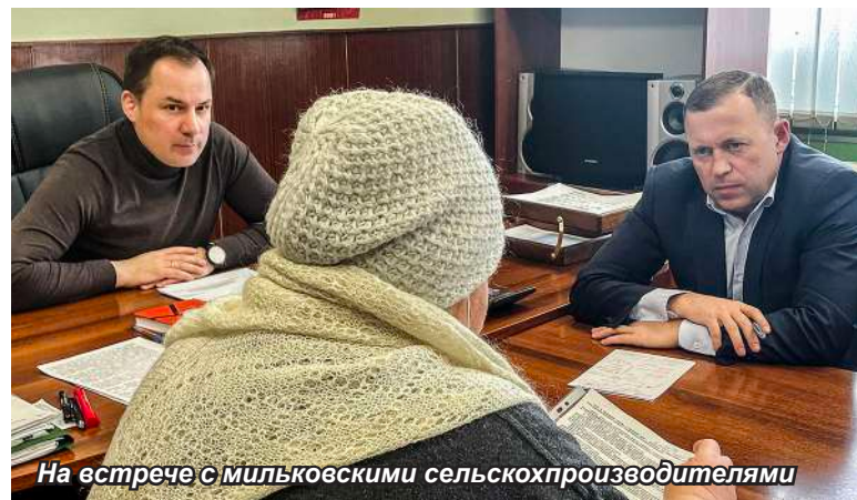
На встрече с мильковскими сельхозпроизводителями

Совместная работа с депутатами строилась на принципах паритета, взаимопонимания и была направлена на соблюдение интересов Мильковского района и его жителей.