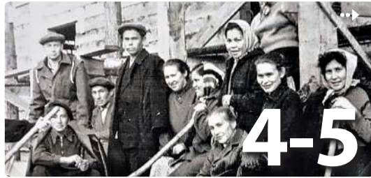
Мильково. 60-е годы