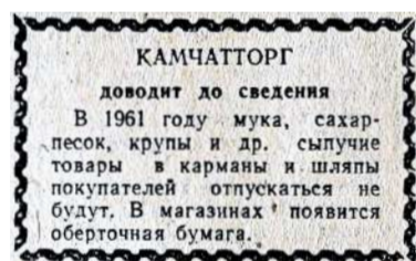
Свой подарок преподнёс и Камчатторг

Государство тоже не отставало. Свой профессиональный праздник в 1960-х годах получили учителя, энергетики, работники милиции, торговли. Во второй половине 60-х годов в сельской местности регулярно снижались цены: на сахар, кондитер-