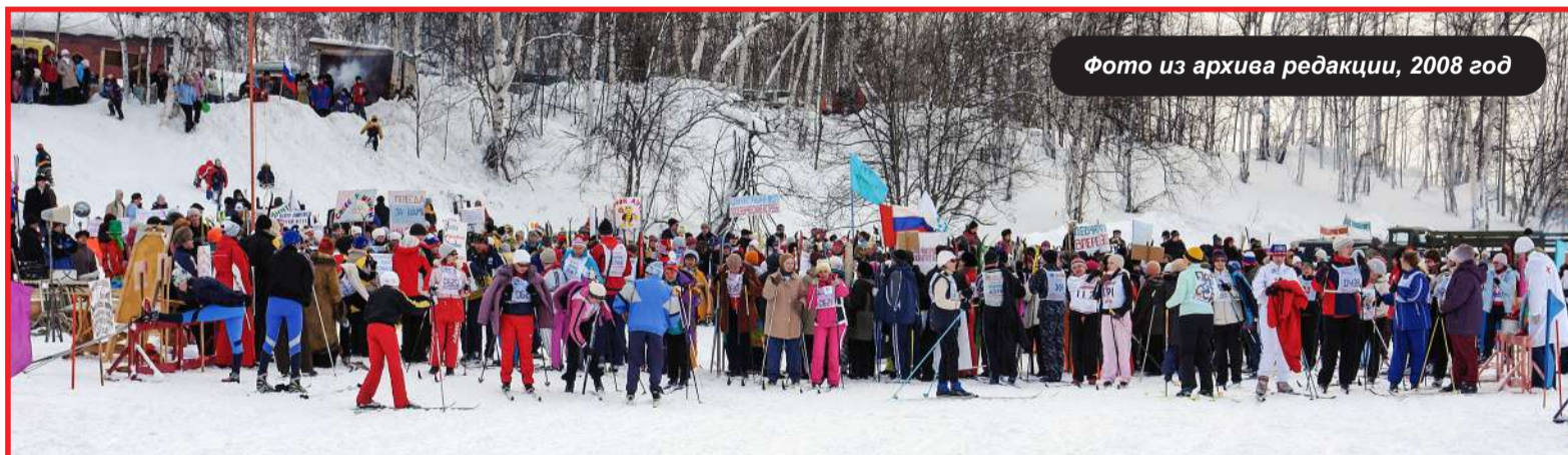
2008 год