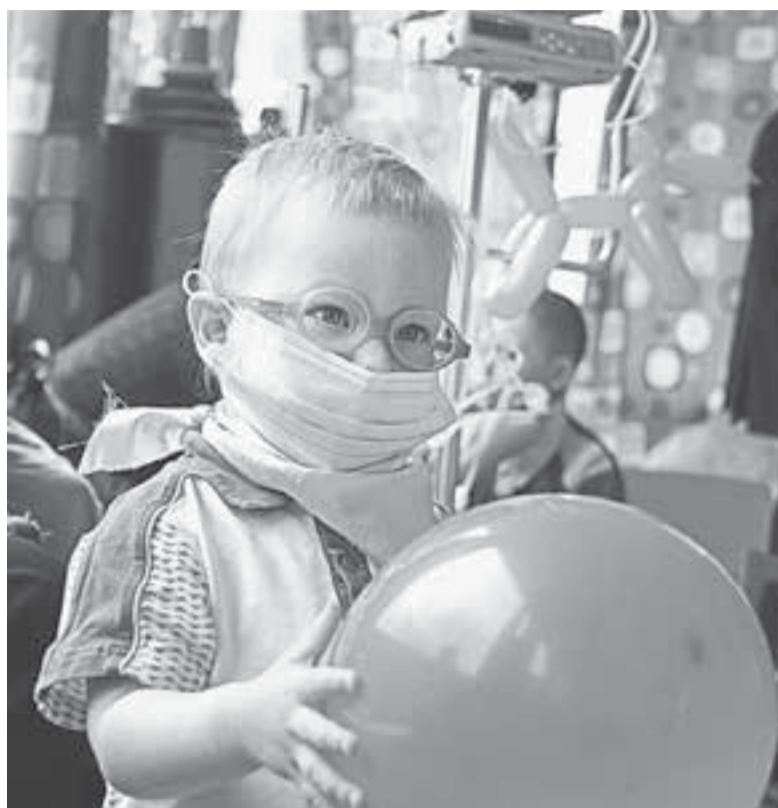
Спасать больных детей надо сейчас, а не когда настанет счастливая Россия будущего.

– Знаете, я просто ничего этого не читал, честно.