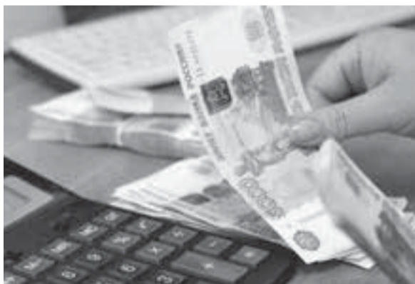
Деньги никому не помешают.

ся ежемесячная сумма в размере установленного прожиточного минимума для трудоспособного населения, на сегодня это 22 851 рубль (постоянная годовая величина).