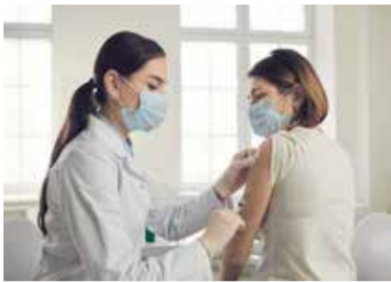
Прививки бояться не надо.

такси, объектов транспортной инфраструктуры, предприятий жилищно-коммунального хозяйства и энергетики.