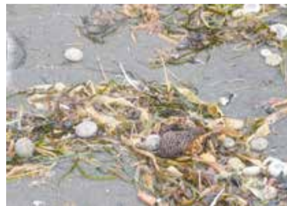
Берег Халактырского пляжа был усеян погибшими морскими обитателями.

вещества и какое воздействие они могут оказывать на живые системы», — рассказал Винников и добавил, что не все биотоксины опасны для здоровья человека и животных.