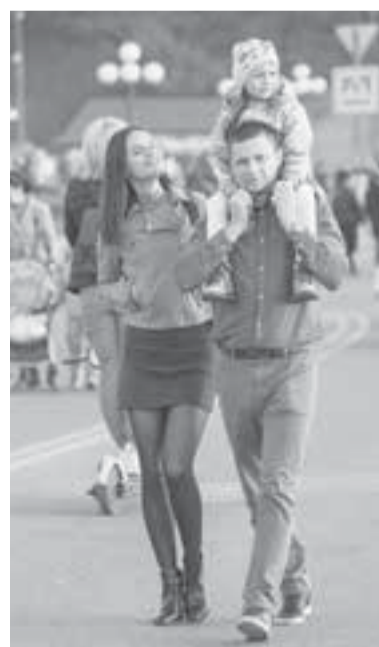
Будущее региона – люди.

«Мы должны реально думать о каждом человеке, который живёт