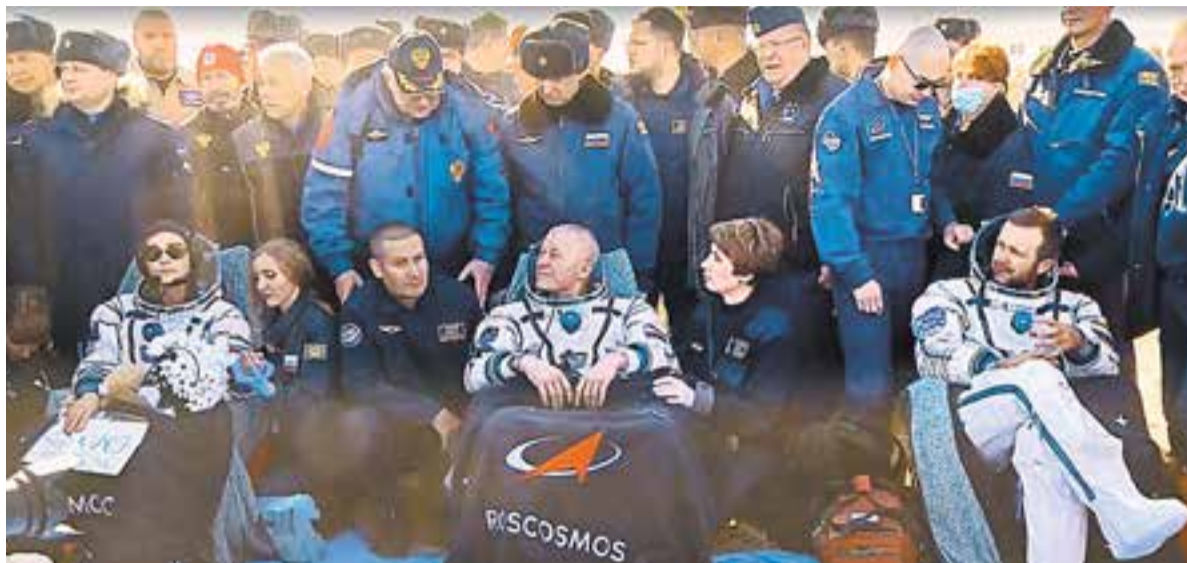
Первый в истории космический «киноэкипаж» после приземления: актриса Юлия Пересильд, космонавт Олег Новицкий и режиссёр Клим Шипенко. Казахстан, 17 октября 2021 г.

После свадьбы Олег 10 лет прослужил на Северном Кавказе, затем поступил в Военно-воздушную академию. А когда заканчивал её, представился шанс пройти отбор в отряд космонавтов. Он, правда, говорил: «Где я, а где космонавтика. Но давай попробую, чтобы в старости внукам рассказывать, что вот, мол, у вашего дедушки был такой шанс». И мы были сильно удивлены, когда ему удалось пройти отбор. Ведь космонавтика была для нас чем-то из учебников истории. Это было похоже