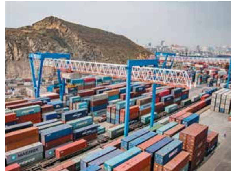
Контейнеры ждут своего часа во Владивостоке.

Губернатор обратился за помощью к полпреду Юрию Трутневу, а тот дал поручение Минтрансу России разобраться