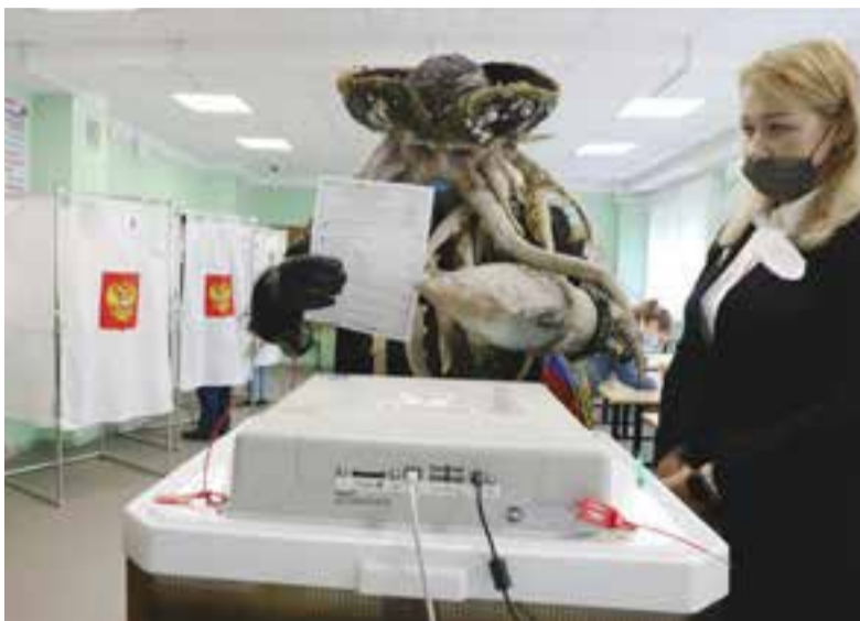
В голосовании принял участие даже осьминог.

От двух бывших претендентов объяснений не последовало, высказалась лишь «справедливороска». Бештерева записала небольшой ролик, который опубликовала на YouTube. Она заявила, что снялась с выборов в знак протеста против, по её