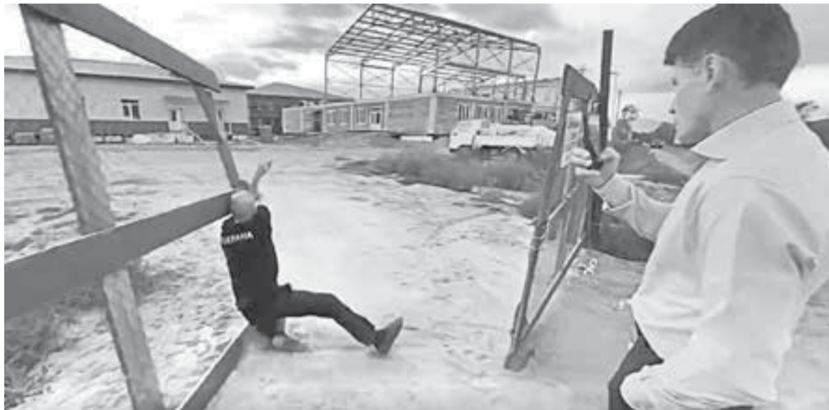
Губернатор Приморья Олег Кожемяко на школьной стройке обнаружил только пьяного сторожа.

В начале сентября губернатор Волгоградской области Андрей Бочаров без предупреждения приехал в едва не снесённый коттеджный посёлок «Белая дача» под Волгоградом и пообщался с местными жителями, которые пытаются легализовать свои дома. Он обещал людям придумать решение их проблемы, признавшись, что «волосы дыбом встают» от того, что он узнал. Жители потом рассказали, что не ожидали приезда главы региона. Схожие эмоции, по их словам, испытали и местные чиновники. «Они все так искренне растерялись, засу-