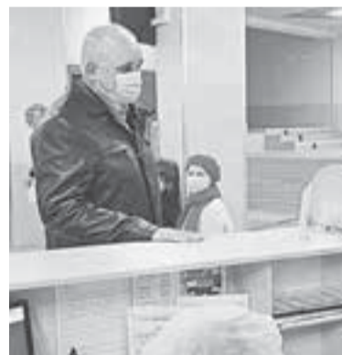
Глава Кузбасса Сергей Цивилёв неожиданно нагрянул в кемеровскую поликлинику.

Ковид, конечно, добавил всем губернаторам забот. Глава Кузбасса Сергей Цивилёв год назад без предупреждения приехал в кемеровскую пятую поликлинику и опешил: люди с высокой температурой стояли по 6 часов