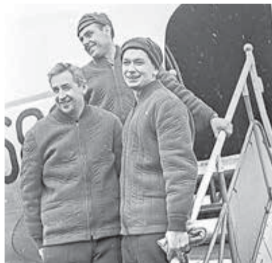
Константин Феоктистов, Владимир Комаров и Борис Егоров после возвращения из космического полёта на корабле «Восход-1», 1964 г. Это был первый в мире полёт многоместного корабля.

– Его потрясающее чутьё космоса, неудержимость в осуществлении своих планов, точнейшие расчёты и прогнозы. Он слишком много знал и за очень короткий срок сделал так много, что обычному человеку подобное не по силам. На это способны только такие люди, которые опережают время, которые пришли к нам