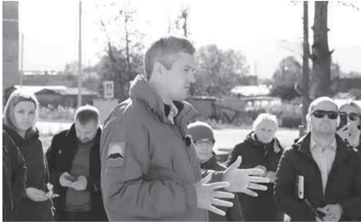
«В селе Мильково проблем достаточно».

«К сожалению, результатов нет, и мы вынуждены принять кадровые решения. Главный врач Мильковской районной больницы, которая отвечает за всю систему здравоохранения района, отправлена в отставку. В ближай-