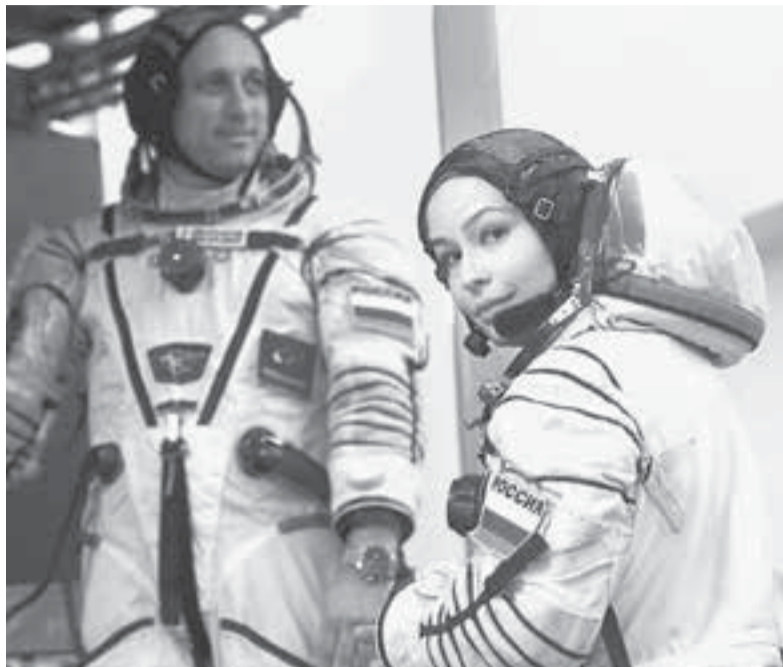
Актриса Юлия Пересильд и космонавт Антон Шкаплеров в Центре подготовки космонавтов. Запуск пилотируемого корабля «Союз МС-19» со съёмочной группой фильма «Вызов» запланирован на 5 октября 2021 г.

Наши миллиардеры – люди прижимистые, деньгами не разбрасываются, а потому туристические полёты в космос организованы за государственный счёт. Думаю, ни у кого иллюзий нет: съёмки фрагментов будущего кинофильма – это не что иное, как развлекательное шоу, организованное Первым каналом и «Роскосмосом». В нём, к сожалению, нет места Большой Науке, ради которой и начиналось освоение космического пространства.