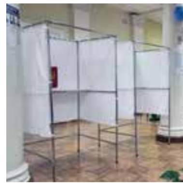
Явка внушала опасения.