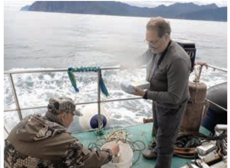
Учёные обследовали Вилючинскую бухту.

Учёные проводили гидрологические исследования в рамках мониторинга основных параметров водной среды в прибрежных районах полуострова, а также изучения восстановительного потенциала прибрежных экосистем юго-восточной Камчатки в районах массовой гибели гидробионтов.