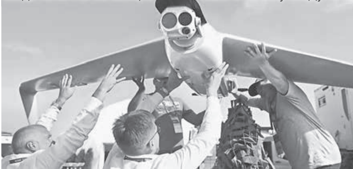
Беспилотник из Ижевска ZALA на выставочном стенде Международного авиационно-космического салона МАКС-2021.

Когда появятся летающие такси и почему пиццу не надо возить дронами