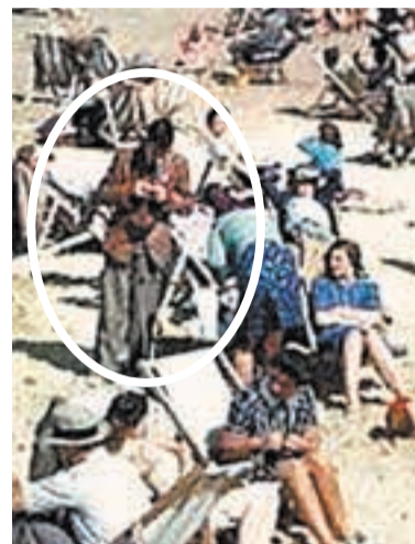
Человек с «отовым телефоном» на пляже в Англии, 1943 г.

ка, выглядящего пришельцем из будущего. Футболка, кофта и солнцезащитные очки на нём характерны скорее для начала XXI столетия, чем для середины XX в. Фото обсуждалось в сети и прессе, после чего было решено, что облик мужчины вполне соответствует эпохе, только отличается от стиля других собравшихся людей большей неформальностью. Даже удалось установить, что на его футболке