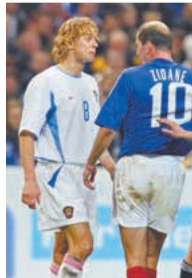
Карпин и Зидан когда-то играли друг против друга.