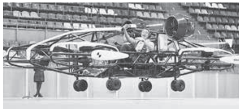
Испытание дрона-такси в помещении Малой спортивной арены в «Лужниках». Беспилотник способен доставлять пассажиров и груз по воздуху на расстояние до 100 км.

Британская компания «Роллс-Ройс» в 2018 г. представила концепцию летательного аппарата с шестью электромоторами, получающими энергию от газотурбинного генератора. В отличие от разработок других компаний, которые работают от аккумулятора, «англичанин» будет летать на керосине. Это значительно увеличивает дальность полёта — она составит примерно 800 км. Максимальная скорость летательного аппарата 250 км/ч. Для заправок предлагается ис-