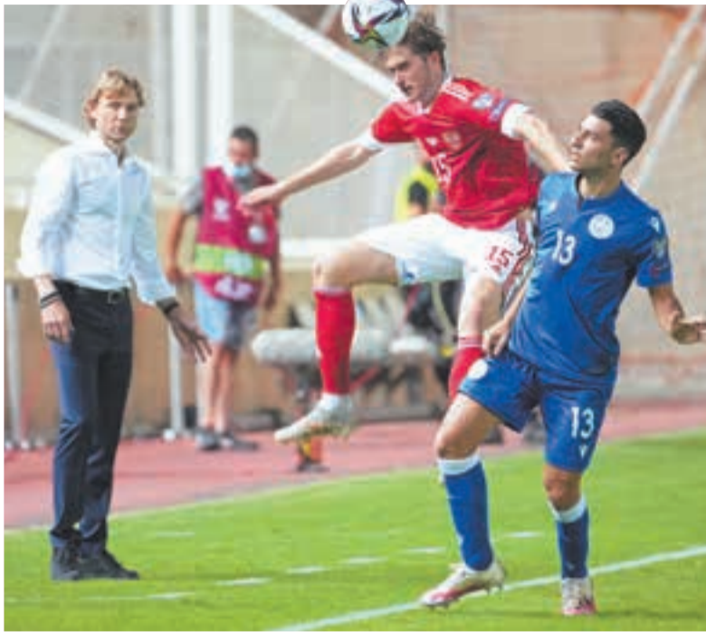
Новый тренер сборной больше доверяет молодым.

— По поводу игроков, которых Карпин позвал в сборную, ни у кого нет никаких вопросов, в отличие от сборной Черчесова, когда было непонятно, по какому принципу попадают некоторые футболисты в команду. Заболотный, Черышев, Бакаев, на мой взгляд, вообще не тянут на уровень сборной. Карпин сильно доверяет молодым ребятам, которых Черчесов оставлял за бортом. Игра пока далека от совершенства, но результат-то есть. В ключевом матче с хорватами мы не проиграли. Уже хорошо. Сборную Кипра, которая до недавнего времени была проблемой, обыграли на их поле 2:0. Два матча провели, не пропустив ни одного мяча. Чего ещё можно желать? Нам пока не до красоты. Сейчас нужен результат. И он есть. Согласитесь, что лучше поехать на чемпионат мира, чем демонстрировать на поле кружева технического мастерства и остаться дома смотреть ЧМ