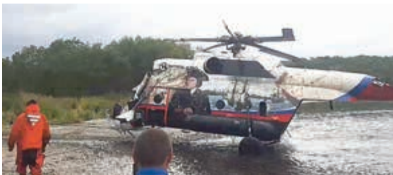
Следователи осмотрят останки воздушного судна.

Напомним, что вертолёт Ми-8 с туристами на борту упал в Курильское озеро утром 12 августа при заходе на посадку в густом тумане. На борту находились 13 пассажиров и три члена экипажа (в основном, туристы из Москвы и Санкт-Петербурга).