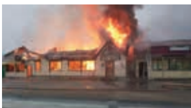
С огнём боролись 7,5 часов.

Позднее к ним на помощь приехали пожарные из посёлка