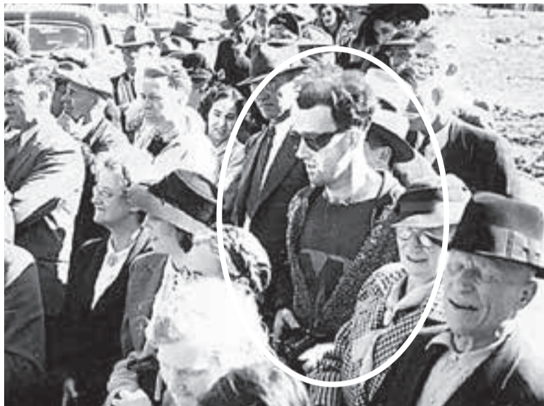
Загадочный кадр из далёкого 1941 г. Среди публики, одетой по моде тех лет, затесался парень «из нашего времени».

О чём рассказывают люди, называющие себя путешественниками во времени?