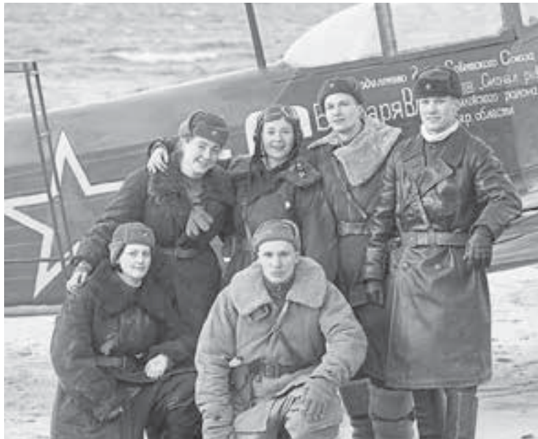
Фильм «Воздух», который сейчас снимает режиссёр, — это масштабная кинодрама о советских женщинах-лётчицах. Кадр из фильма

Режиссёр А. Герман — о крадущейся мудрости и свыкании с войной