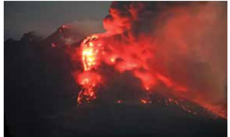
Красиво, но лучше наблюдать издалека.