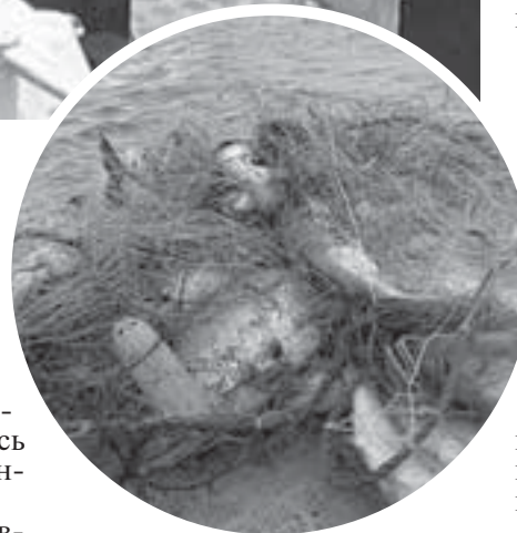
Рыбу и снасти уничтожили.

К версии «находчивых» граждан критически отнеслись и су-