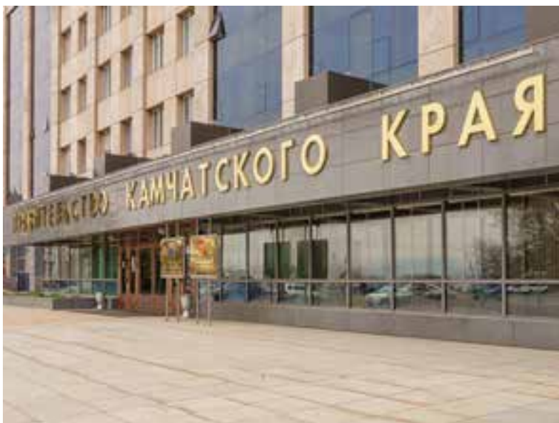
В главном здании мест на всех не хватает.

«Нами совместно с министерством финансов и министерством имущества края проведена работа, создана специальная рабочая группа, которая прошла по органам власти, по подведомственным учреждениям. Мы проверили 23 органа власти и 63 подведомственных учреждений... Что мы видим? Что общая сумма у нас составляет 32 641 квадратный метр. В соответствии с нормативами, которые установлены постановлением правительства края, превы-