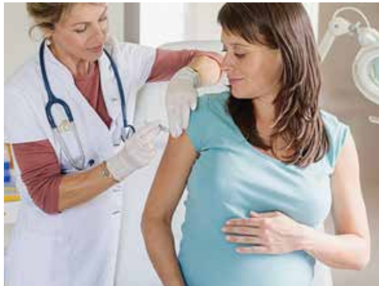
Беременность не является противопоказанием для постановки прививки от ковида.

— Насколько часто в регионе беременные женщины болеют ковидом? Каков алгоритм врачебной помощи таким пациентам?