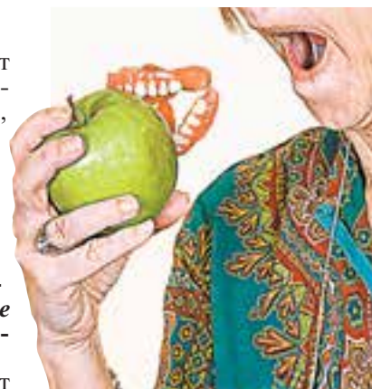
Поздно есть яблоки, когда челюсти уже вставные.

— Потому что он имеет не гладкую поверхность, а складки и неровности, выстланы нитевидными сосочками. Всё это способствует тому, что мягкий налёт остаётся в нишах, в которых размножаются бактерии, в результате мы имеем дело с неприятным запахом изо рта.