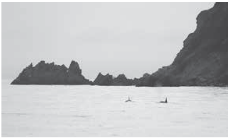
Обрадовало большое количество косаток.

«Большинство серых китов, которые летом мигрируют