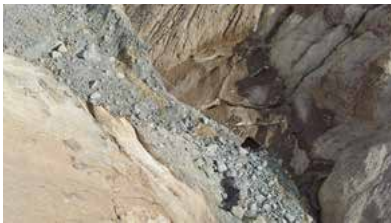
Сход селевых потоков возможен в любой момент.