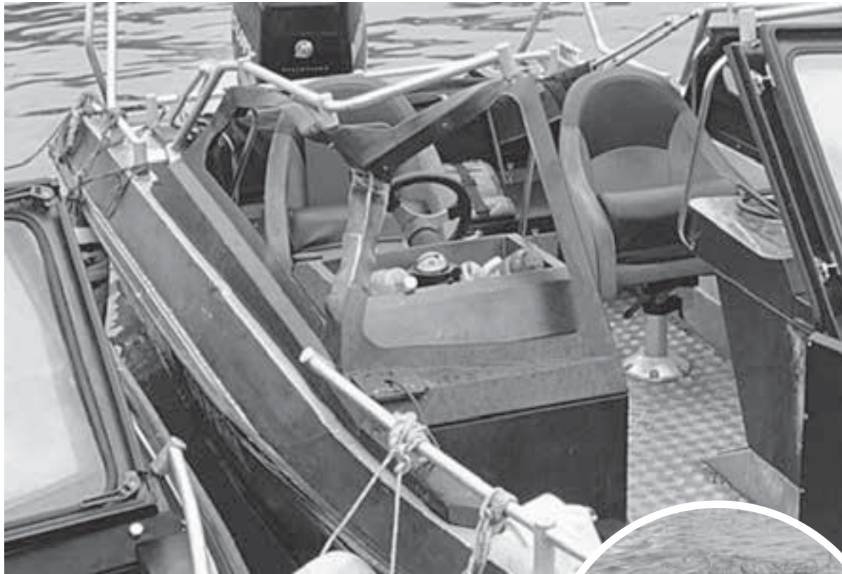
Браконьеры таранили лодку пограничников.

Позже, во время судебных разбирательств, бригадир и вовсе заявил, что с Г. никогда не был знаком, а на пирс приехал, чтобы зарегистрировать лодки. Внезапный приступ