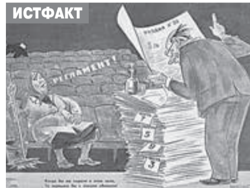
«Когда бы вы сидели в этом зале, то первыми бы с лекции сбежали»... Советский сатирический плакат о том, что скучные лекции не нужны никому. Художник Б. Иванов

- Как не знают и имён молодых учёных. Если раньше образ