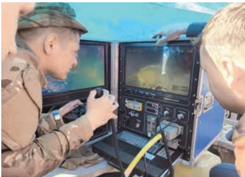
Поиски велись несколько дней.