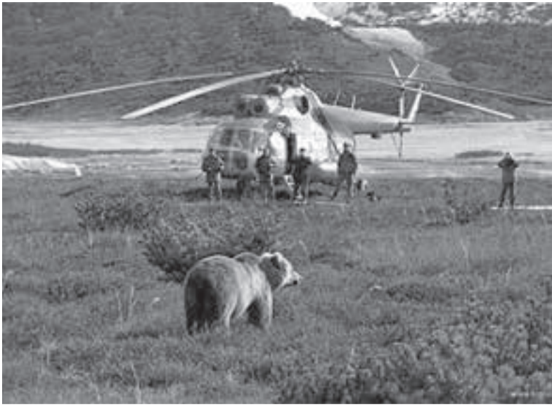
Хищников лучше рассматривать издали.