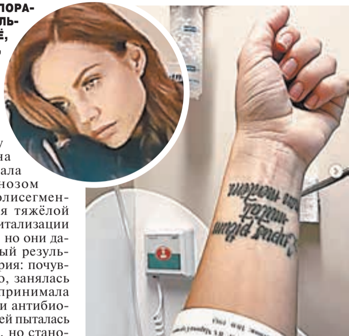
Певца МакСим провела в состоянии искусственной комы больше 2 месяцев.

Что говорят известные люди после «знакомства» с коронавирусом