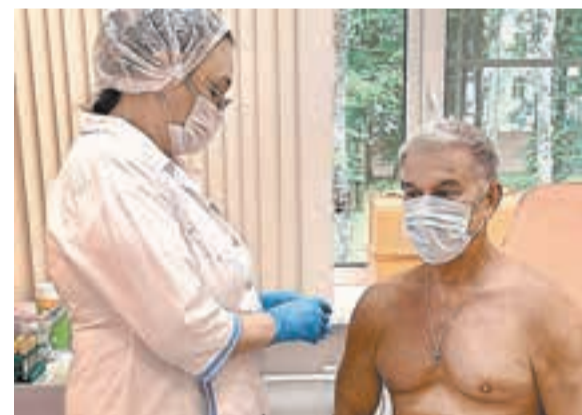
Олег Газманов после того, как переболел, решил сделать прививку.

В октябре ковид подтвердился и у 33-летней актрисы Кристины Асмус. По её словам, температура долго не сбивалась. Были и кашель, и ломота, и головокружение. В изоляции провела 18 дней. «Три дня были прямо жёсткими – температура выше 39. И ниже 37,7 даже после жаропонижающих не опускалась. Краснющее горло, кашель, адская ломота всего тела и голова раскалывается. Два