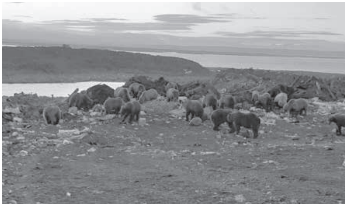
Медведи десятками собираются на свалках.

сти, для современного человека снижается.