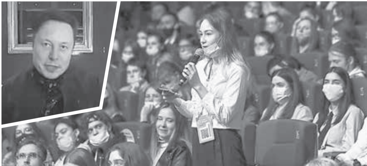
В российском марафоне «Новое знание» по видеосвязи участвовал глава компаний SpaceX и Tesla Илон Маск. Он рассказал, каким видит будущее через 50 лет. Свободных мест в зале не было.

В чём секрет успеха обновлённого просветительского общества?