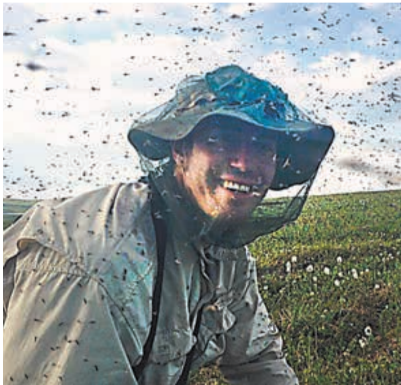
Голодные комариные самки летят на своих жертв без разбора.

Для поиска жертвы комары используют зрение и обоняние. У них есть предпочтения. Имеет значение возраст жертвы. Если рядом будут молодой и пожилой человек, то комары заинтересуются в первую очередь