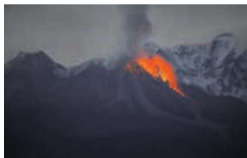
Со склонов идёт раскалённая лава.