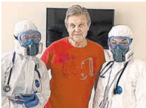
Одним из первых звёзд, перенёвшим ковид, стал Лев Лещенко.