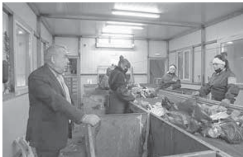
На заводе возобновлена сортировка мусора.

ступить к работе. Депутаты взяли этот вопрос под контроль.