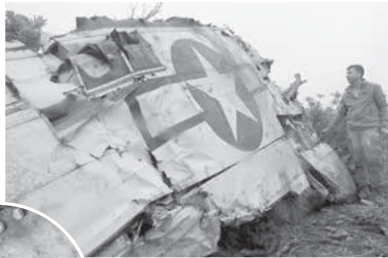
Крыло бомбардировщика Lockheed PV-1 Ventura.

Морской ударный самолёт ПВ-1 «Вентура» нашли у мыса Лопатка в районе залива Камбалный. Самолёт лежал в зарослях кедрового стланика.