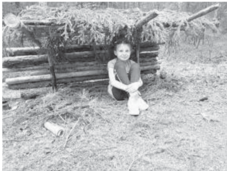
В школе «Таксар Махум» уже 1,4 тыс. ребят научились премудростям выживания в тайге.

Следующий шаг – развести огонь и сделать себе оружие. Можно сломать молодую берёзку, обжечь ствол, из тонкой