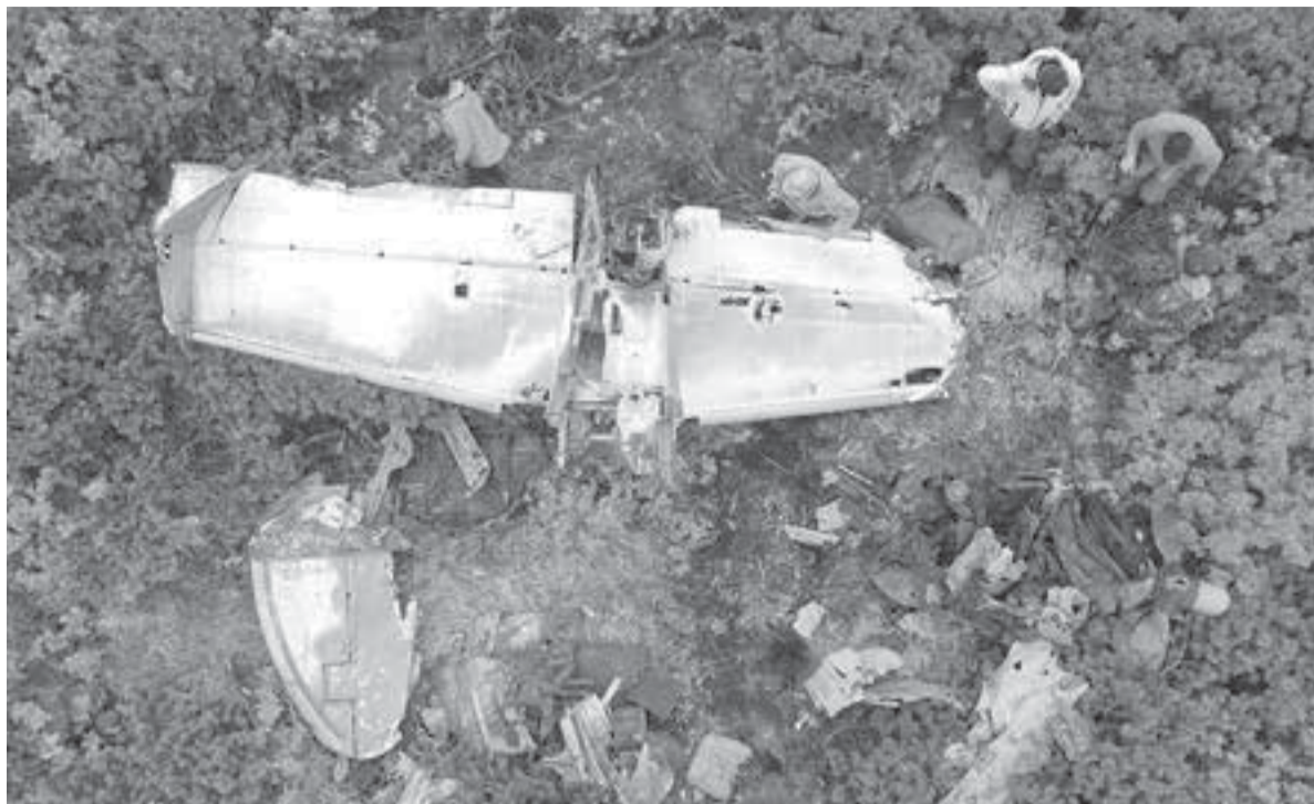
В отсутствие серийного номера борт иногда приходится идентифицировать методом исключения.

Полевой лагерь экспедиции разбили в районе бухты Вестник. Всю организационную работу, включая транспортировку группы на вертолётах и решение хозяйственно-быто-