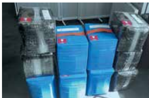
За год в личном багаже вывезли больше 600 тонн.

Он отметил, что пока не удалось найти решения по авиаперевозке икры с юридической точки зрения. Так, например, ограничить объём перевозимой икры не получится через ветеринарное оформление. «Мы не смогли сделать так, чтобы для гражданина, вывозящего икру, это было просто, потому