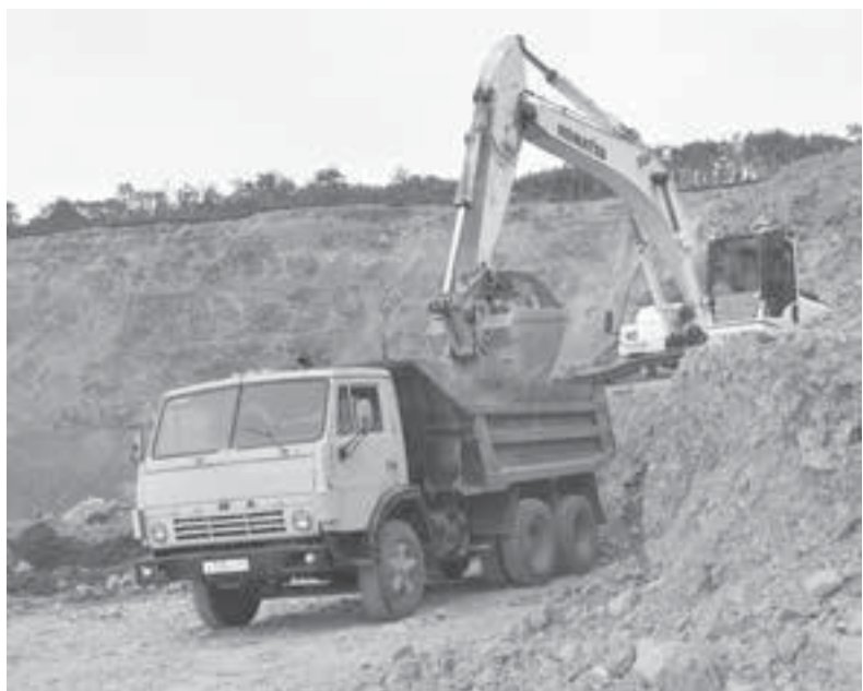
Работы в карьере не вредят экологии.

экспертизы, в которой задействованы серьёзные институты.