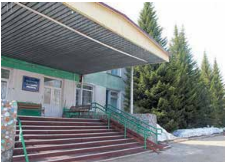
Здравница находится в Паратунской курортной зоне.

«Общество неоднократно обращалось в Правительство Камчатского края за финансовой поддержкой. Кредит не выдают из-за имеющейся налоговой задолженности. На настоящий момент кредиторская задолженность составляет примерно 50 000 000 рублей. Заработную