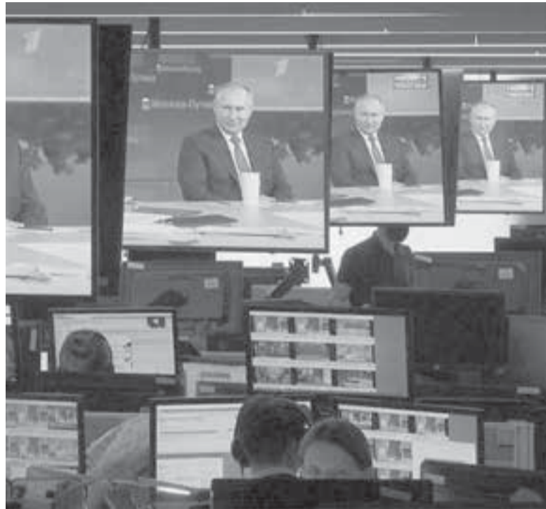
К мнению граждан нужно прислушиваться.

«Отдельный наш приоритет – это обеспечение доступности свежего куриного яйца – значимого продукта в потребительской корзине. Мы смогли за счёт стабильного функционирования нашей птицефабрики «Пионерская» добиться того, что цена на яйцо у нас сопоставима с ценой в центральной части России. Ещё один приоритет – обеспечение овощей. Президент говорил о так называемом «борщевом наборе». Здесь мы поддерживаем наших производителей, которые в последние годы существенно сократили посевные площади. Мы остро почувствовали, что картофель и капуста, которые завозились на Камчатку, выросли в цене после истощения местных запасов. В этом году мы выделили серьёзную поддержку предприятию «Овощевод», и объём посевных