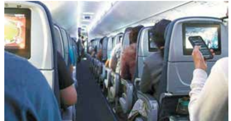
С соответствующим должности комфортом.

В «пролёте» оказались 21 министр, четыре руководителя агентства, столько же руководителей инспекций и служб и четверка уполномоченных. Однако для членов правительства и президиума Заксобраний перелёты более 4 часов будут возмещаться по тарифу «бизнес-класс». Как