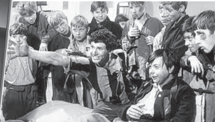
Панибратство и заигрывание в отношениях между учителем и учениками до добра не доведут. Кадры из фильма «Республика ШКИД»

в разных возрастных категориях. А врать детям нельзя!»