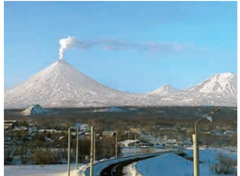
От посёлка до Ключевской группы вулканов — рукой подать.

— Помните слова из неофициального гимна Камчатки — песни Игоря Демарина «Мой дом — Петропавловск-Камчатский»? «Это красиво — сопки в тумане. Это нормально — жить на вулкане». Так вот, мы ежедневно живём как на поро-