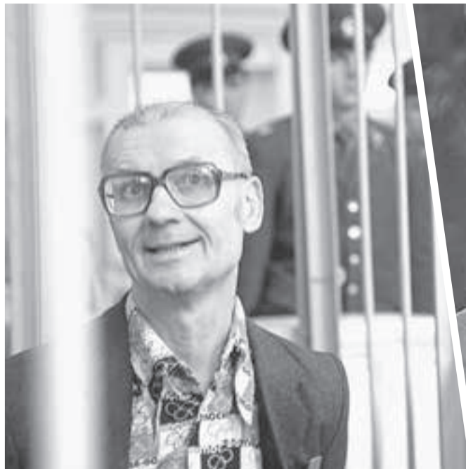
Чикатило реальный и киношный.