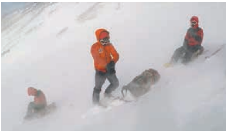
Погода на вулкане испортилась резко.

Группа из трёх альпинистов, двое из которых из других ре-