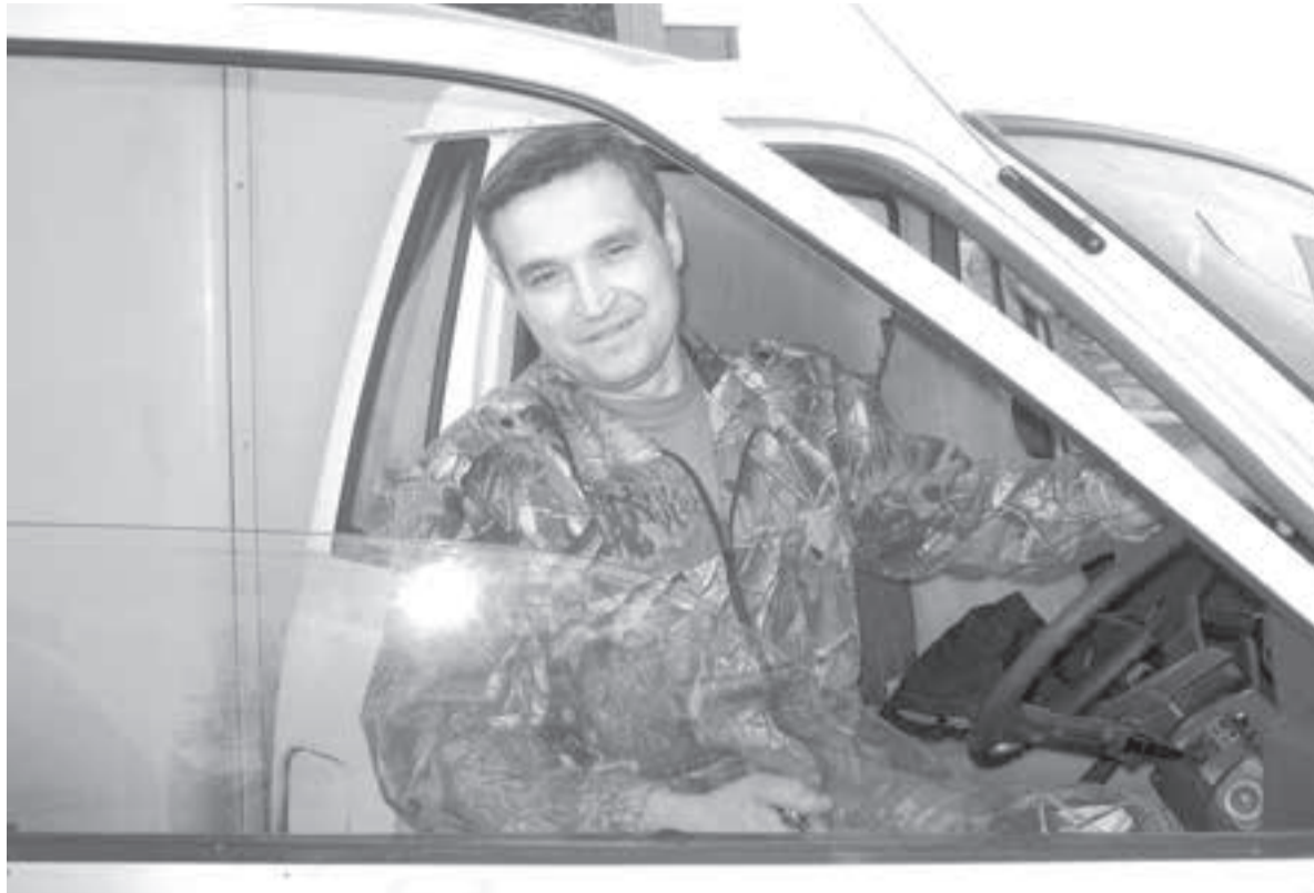
Граната упала в метре от грузовичка, и раздумывать было некогда.

- Служил в разведке, разные операции были. Понима-