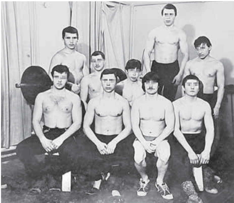
«Пацан должен держать базар, а значит, он должен быть в хорошей спортивной форме, а не под кайфом». На фото: группировка «Низы». Казань, 1985 г.

Как их вытеснить с улиц? Не милиция и не армия должны были это делать — разгонять народ с площадей, поскольку нехорошо и некрасиво. А кто тогда? Например, другая молодёжь — пролетарская, сотни крепких ребят из ПТУ. И что милиция против пэтушников будет делать? Это же тоже народ. Поэтому некоторые эксперты и советуют задуматься, почему группировки всё-таки не разгоняли, а давали им расти как на дрожжах. Да