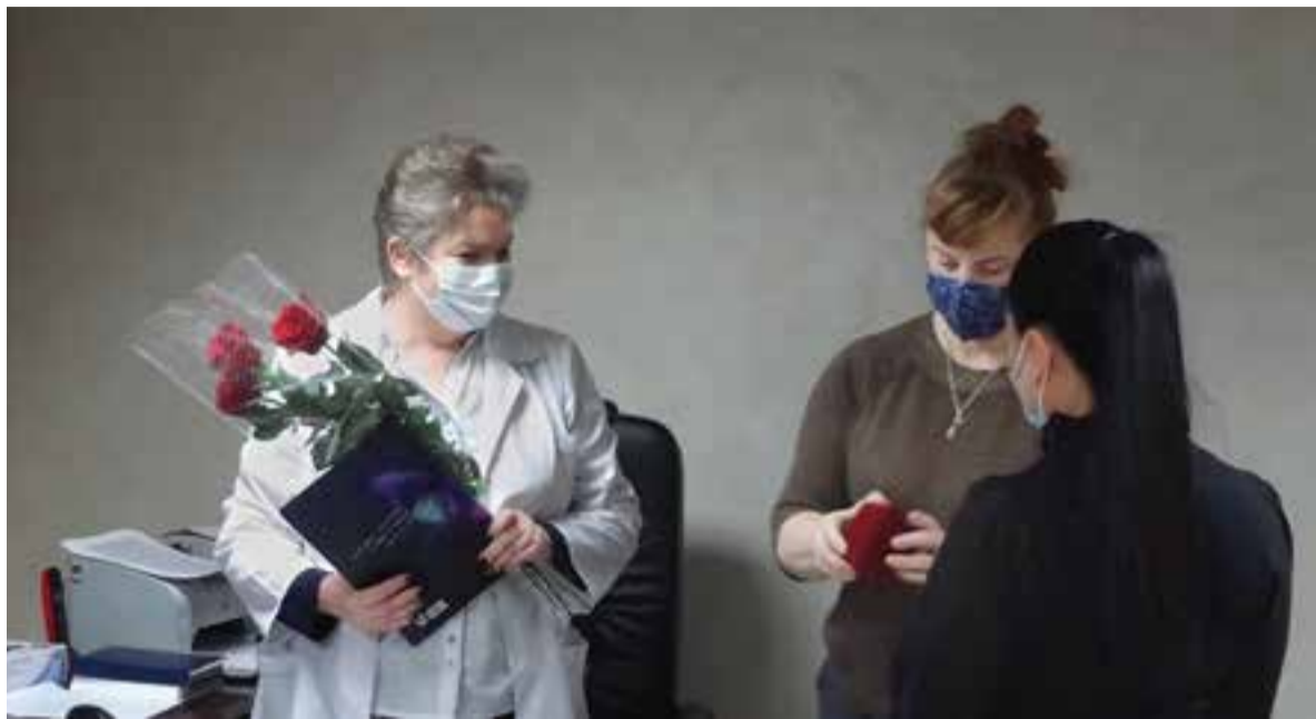
Главный врач и коллектив диспансера принимают поздравления.

Соответственно, нагрузка на специалистов колоссальная. Каждый врач не только работает в определённом отделении, но и занимается психиатрическими осмотрами при выдаче справок, диспансеризацией, судебно-психиатрической экспертизой, еже-