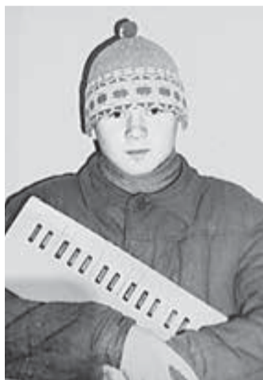
Такими с виду безобидными были школьники, участники казанских группировок.

потому что эти ребята могут при случае помочь, при правильном раскладе можно их использовать в своих целях.