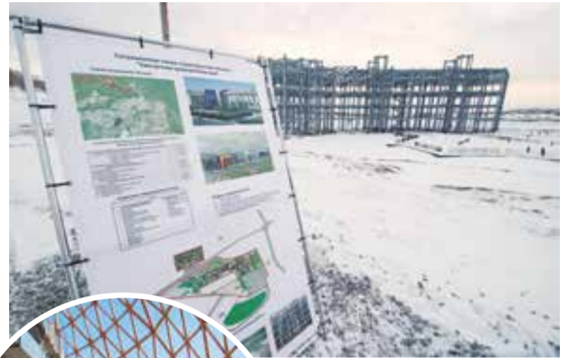
Гладко было на бумаге...

«С 2013 года объект строится, потрачено большое количество времени, поэтому председателю Правительства РФ и вице-премьеру Правительства РФ поручили Минстрою довести строительство до логического завершения. Этот объект очень важен и для Петропавловска-Камчатского, и для края в целом, поэтому мы приложим все усилия, чтобы достроить его. В перспективе здесь планируется жилая застройка, в том числе индивидуальное жилищное строительство, а созданная инфраструктура, в частности, краевая больница,