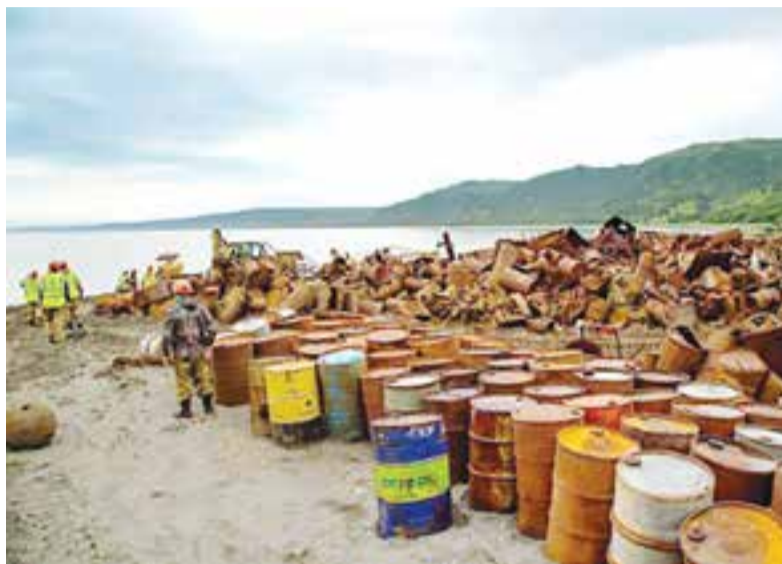
Отходы захоронили в заповеднике.

При этом участники организованной группы создали видимость утилизации ком-