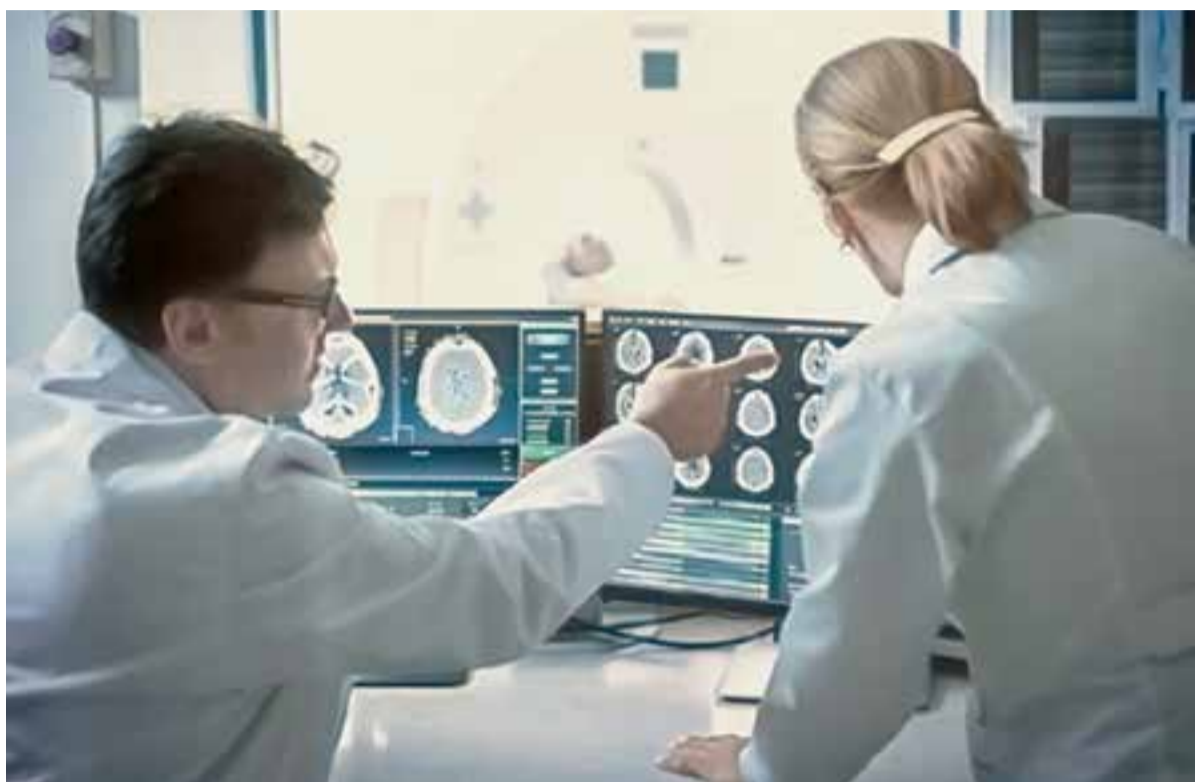
Ранняя диагностика рака позволит избежать серьёзных осложнений.

- В прошлом году в рамках нацпроекта у нас появились передвижной рентгеновский