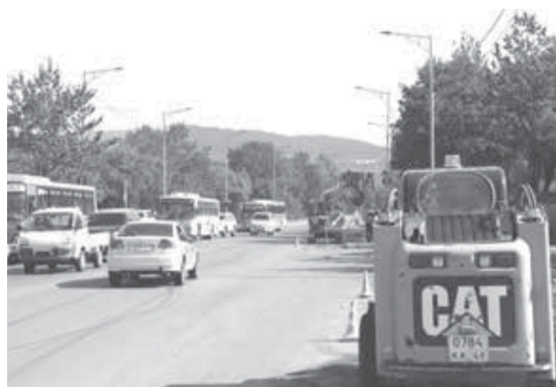
Дорожные работы продолжаются.

транспортных происшествий. Яркий пример тому – обустройство безопасной дороги в школу № 8 возле детской поликлиники по предложению школьника. Ребёнок написал, его проект рас-