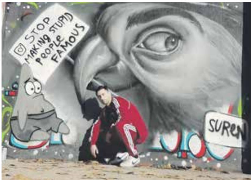
«Хватит делать глупых людей знаменитыми», – призывает художник.

– Ты – участник фестиваля уличного искусства и граффити. Для жителей края это событие