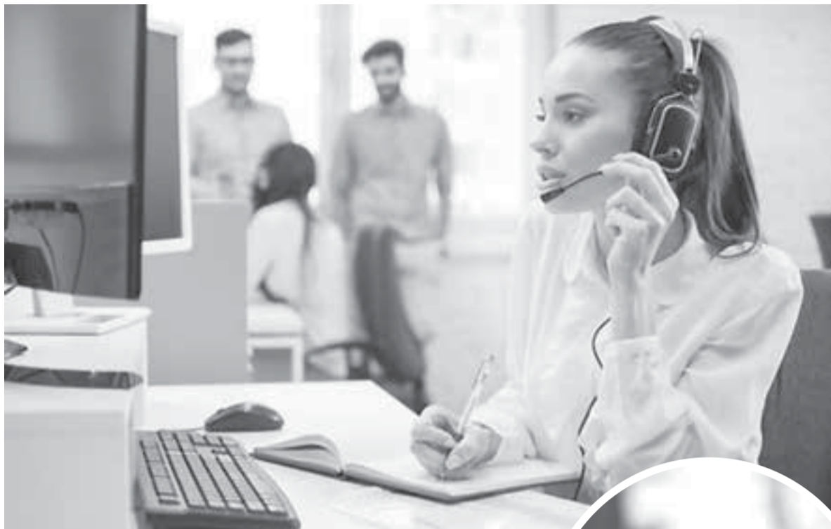
В Контакт-центр ОМС можно обращаться в любое время.

Как защитить свои права на бесплатное медобслуживание