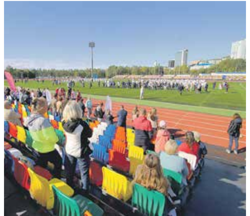
Первые тренировки прошли при зрителях.