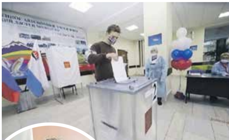
Камчатцы поддержали главу региона.

В теледебатах, неожиданно для многих, участвовал и действующий глава региона Владимир Солодов. Однако упор в предвыборных баталиях он сделал на другом. В регионе за последние месяцы были запу-