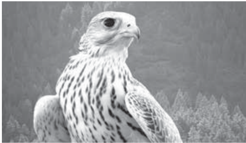
Камчатские кречеты популярны в арабских странах.

Он отметил, что реализация целого ряда проектов для достижения этих целей уже проработана совместно с Минприроды России. Владимир Солодов обозначил ключевые направления. Это развитие сети особо охраняемых природных территорий, нахождение баланса между разными отраслями экономики – горнодобывающими, туристическими и рыбодобывающими предприятиями. Третье – дальнейшее развитие Камчатки как экологически чи-