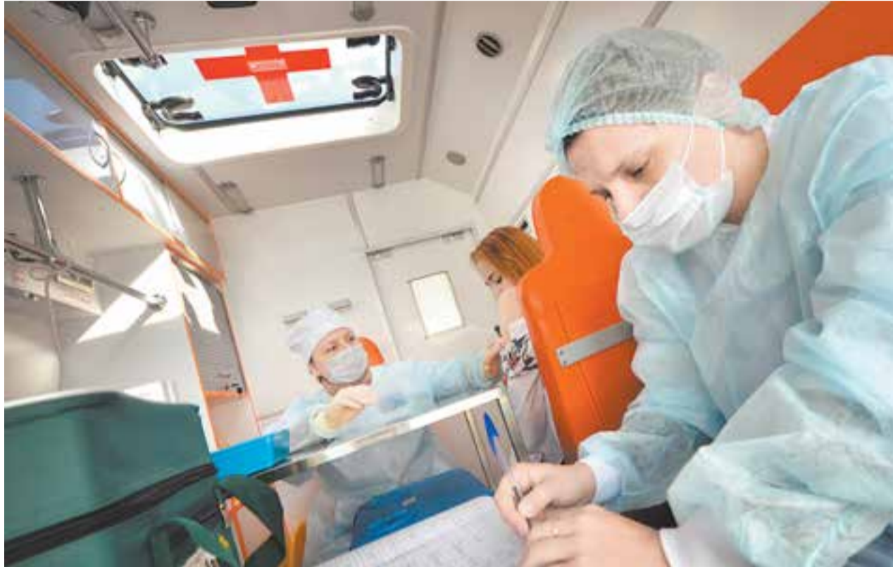
В Москве прививку от гриппа делают не только в поликлиниках, но и в передвижных пунктах у станций метро. Хочется надеяться, что и вакцинирование от коронавируса станет столь же доступным.

При этом аденовирус полностью обезвреживается, он не наносит вреда организму, а используется как платформа. На эту платформу сажаются ген шипа коронавируса и, как на тележке, к нашим иммуно-