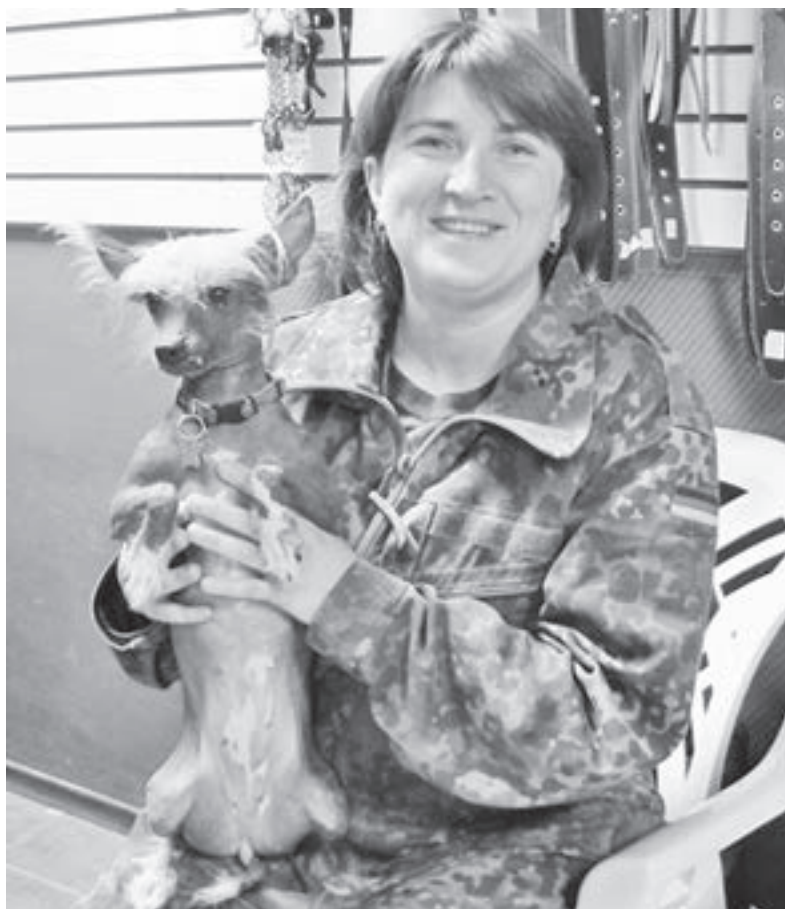
«Собаки бывают разные».

Потом я узнала, что в России существует два центра канистерапии: в Москве и Санкт-Петербурге, но московский работает только с породой золотистый ретривер, а Санкт-Петербургский — с собаками всех пород. Вы будете удив-