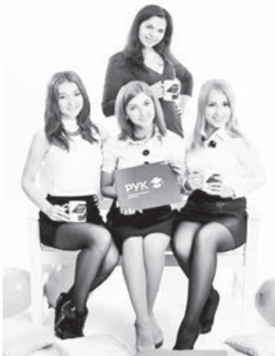
В РУКе – уникальная образовательная среда.

... У новоиспечённых студентов – будущих юристов – вторая «пара». Предмет серьёзный – «Теория государства и права», поэтому прилежные первокурсники повторяют аккуратно написанные лекции. И с удовольствием рассказывают, почему выбрали именно РУК для получения высшего образования. «Во-первых, сам университет располагается почти в центре города, в шаговой доступности от автобусной