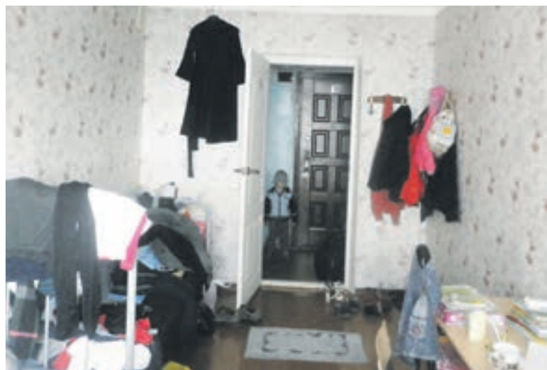
Одна из комнат на Командорской, 3.