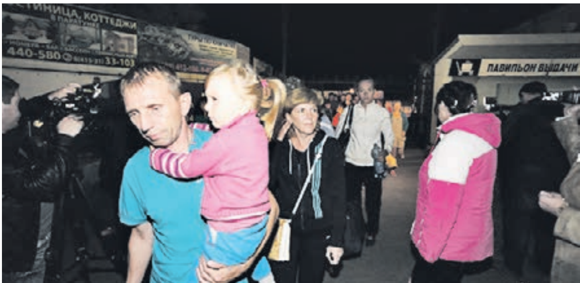
2 сентября 2014 года. Первые шаги по Камчатке. Впереди – неизвестность.