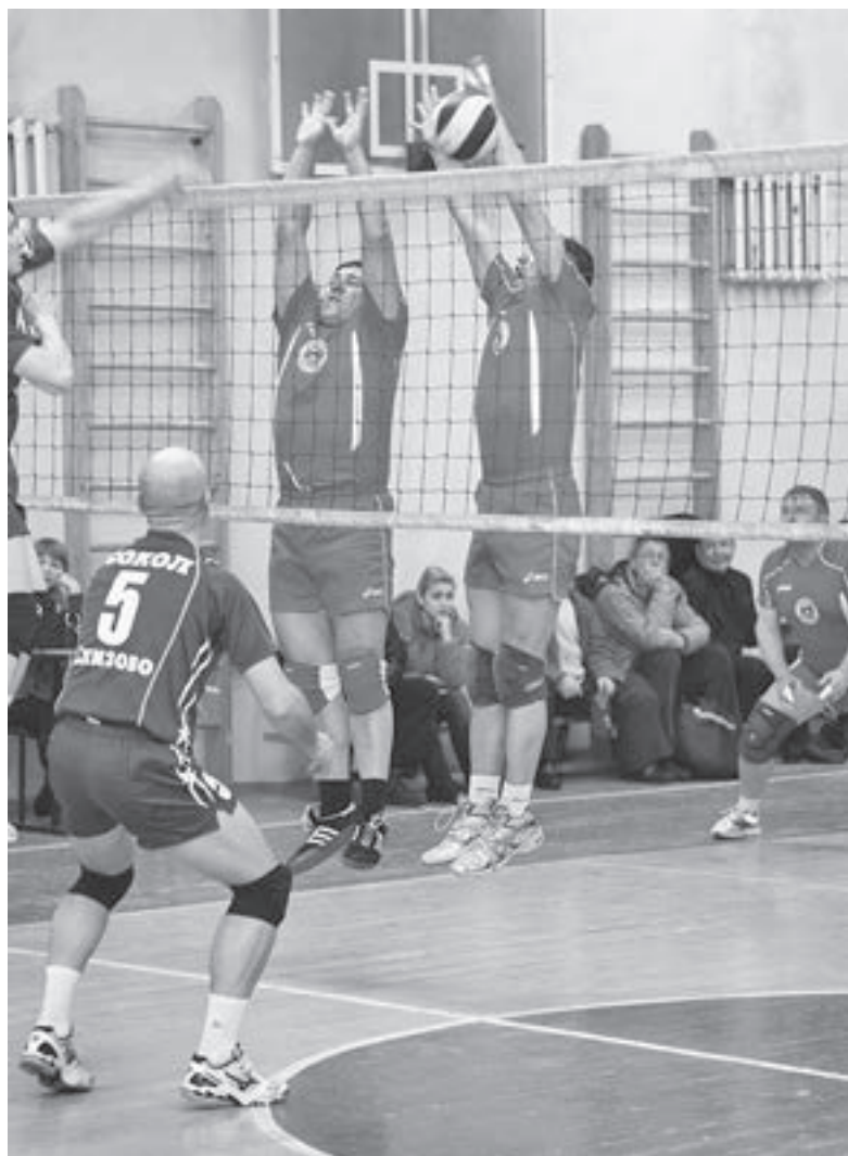
«Второе дыхание» пробить трудно.

Поэтому одна из причин, привлекающих сюда людей, – это общение. Мы сплотились, помогаем друг другу. У каждого из нас свои проблемы и заботы, но когда кому-то плохо, мы объединяемся и помогаем. Например, у одного из наших