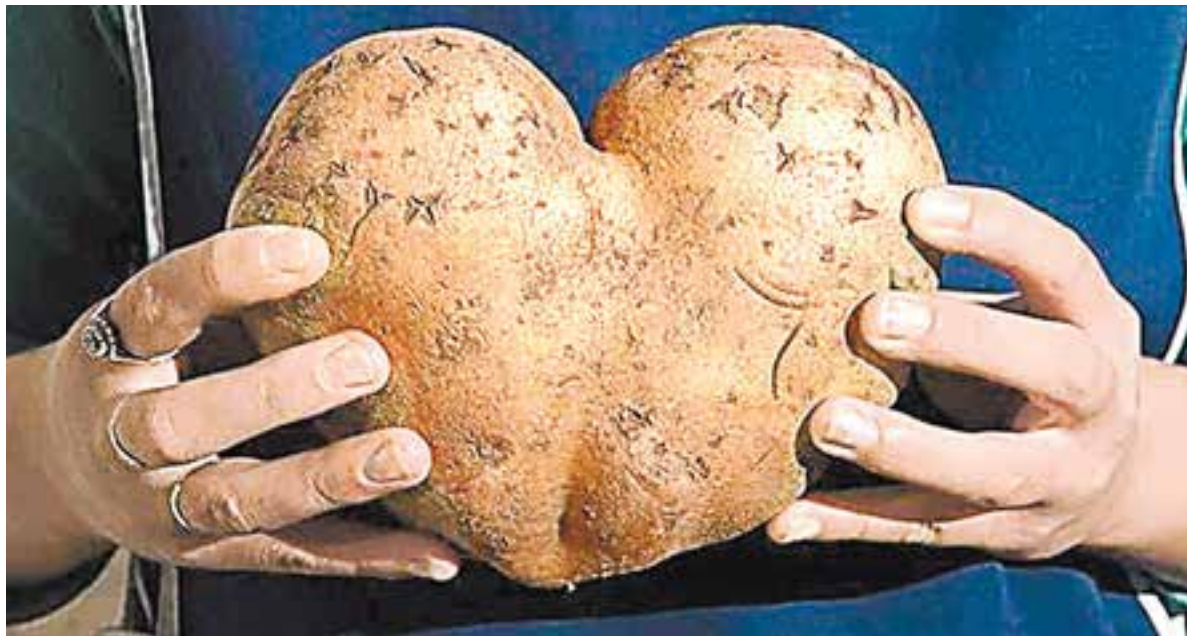
Картошка — любовь моя?

Пользы от неё больше, чем вреда. Нужно только уметь её готовить