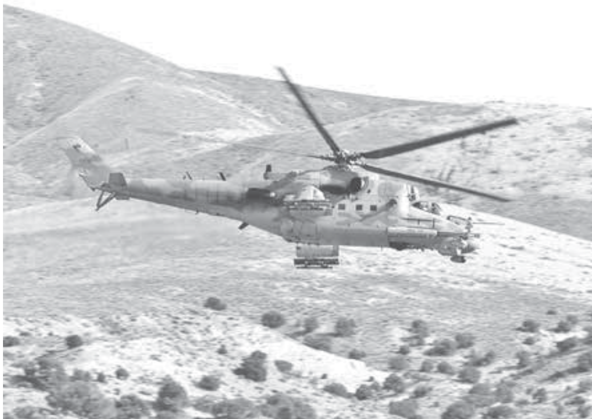
Летать приходилось на предельно малых высотах.