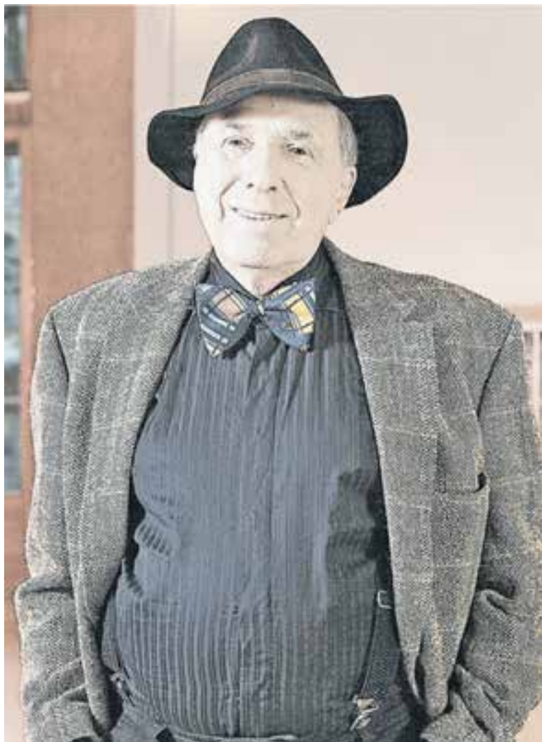
Мы запомним его именно таким: с лёгкой, чуть ироничной улыбкой и серьёзным отношением к жизни.

На спектаклях «Предбанник», «Провокация», «Вечерний звон. Ужин у товарища Сталина» всегда были аншлаги. Последняя работа «Полёты