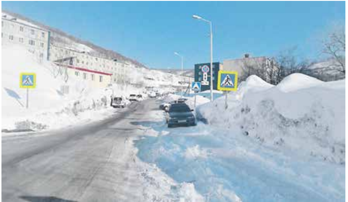
Водители паркуют машины рядом с запрещающими знаками.

Где в Петропавловске припарковать авто без проблем