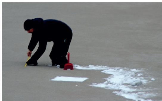
Вулканологи собрали свежий пепел.