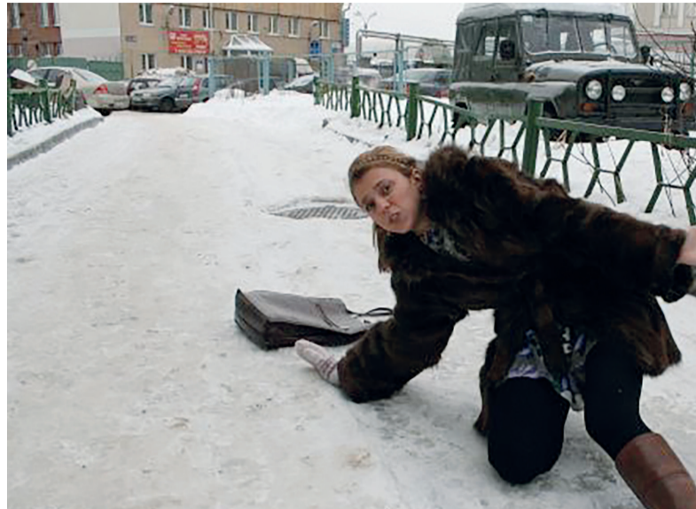
Гололёд опасен для здоровья