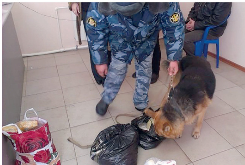
Сомнительные сумки проверяют собаки.

Анонимное сообщение с угрозами терактов появилось и в социальных сетях. «Наверняка слышали про взрывы в Магнитогорске? Теперь очередь дошла и до вашего города», – говорится в письме, которое рассылали злоумышленники.