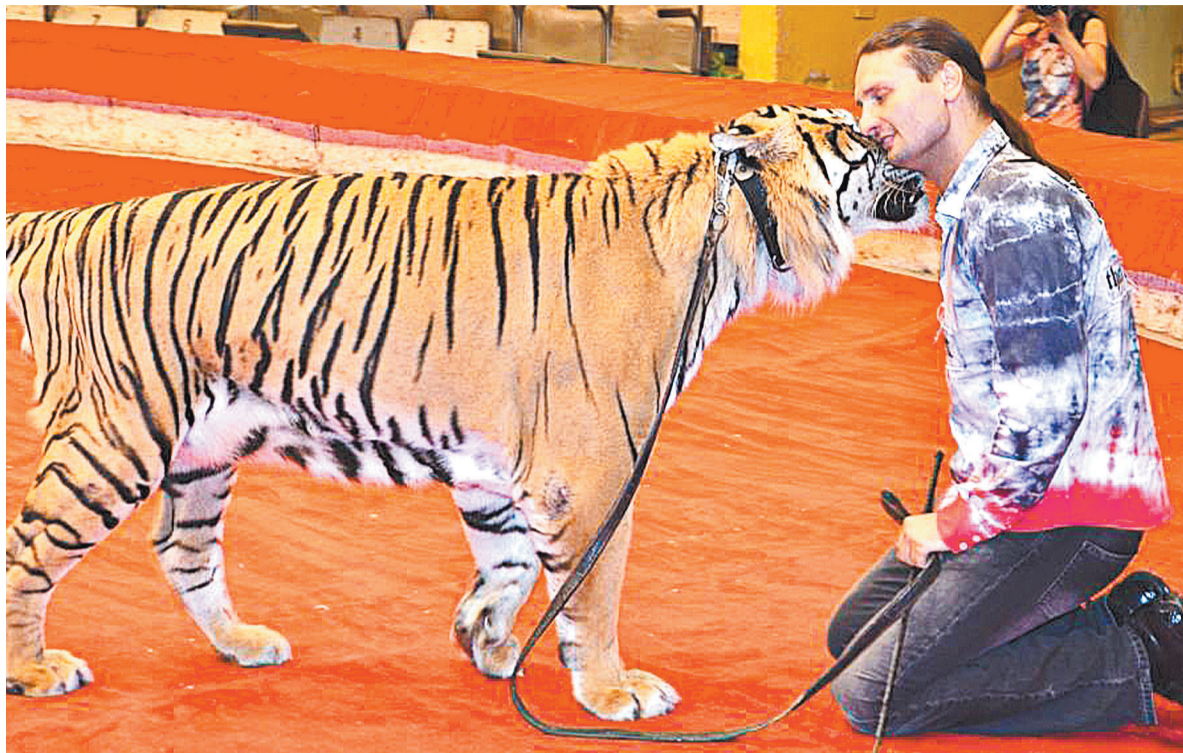
Эдгард Запашный: «Цирк не является местом издевательств над животными».

Эдгард Запашный: «Цирк «Дю Солей» — это монстр с добрым лицом»