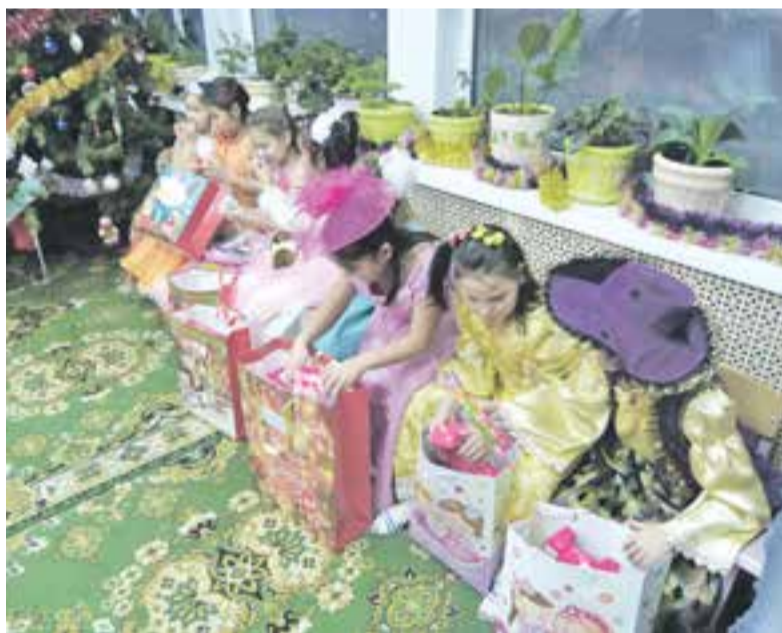
Что там за подарки?

В преддверии Нового года каждый желающий смог приготовить подарок одному или