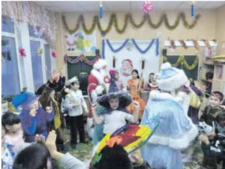
На утреннике было весело...

Как читатели «АиФ-Камчатка» стали добрыми волшебниками