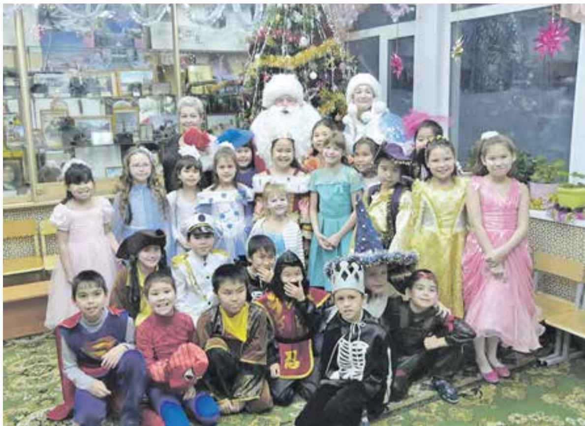
В гости к детям пришли Дед Мороз и Снегурочка.

Как читатели «АиФ-Камчатка» стали добрыми волшебниками