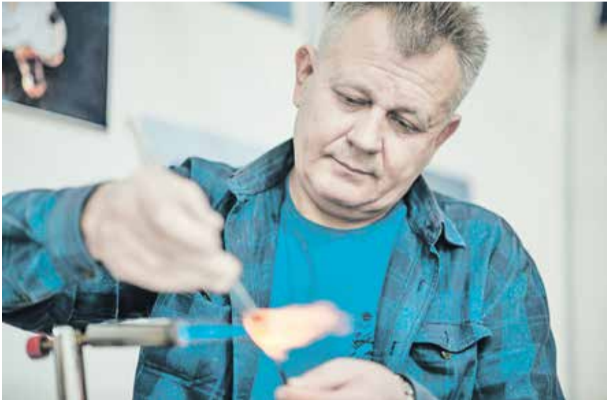
«Зажигаешь пламя — и поехали...».

Как создают миниатюрные шедевры из хрупкого материала