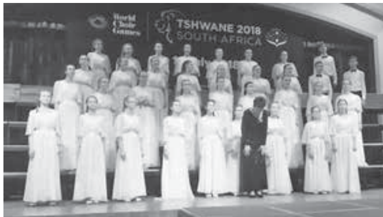
Камчатский хор обошёл около 30 коллективов.