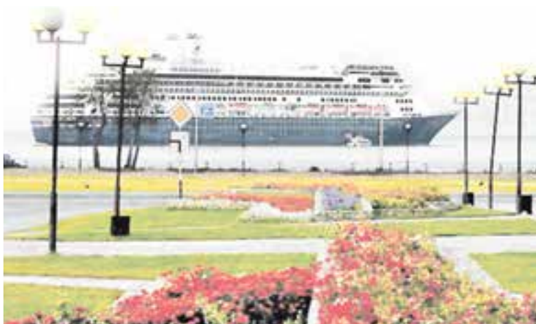
12 иностранных лайнеров заходили в Петропавловск.