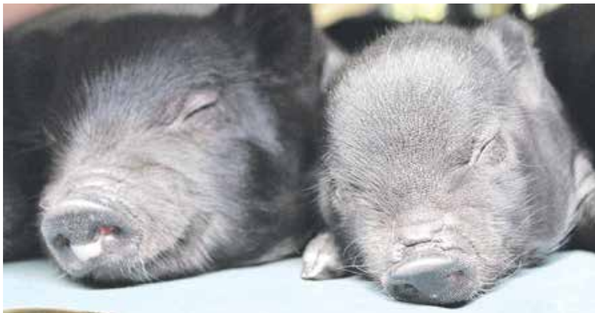
Главное — не проспать удачу в Новом году.

У кого весь год пройдёт легко и непринуждённо