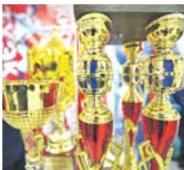
Завоевали 167 медалей.

По итогам уходящего года лучшей спортсменкой Камчатского края признана мастер спорта, чемпионка России и Ев-