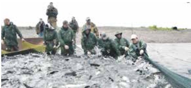
Таких подходов рыбы никто не ожидал.