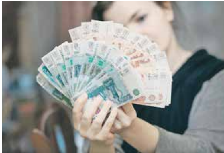
Камчатские работники получают от 31 тысячи до 72 тысяч рублей.

В интересах работников, обратившихся в прокуратуру, в суды направлено 162 заявления, которые рассмотрены и удовлетворены. Общая сумма задолженности, погашенной за 10 месяцев, составила 97,5 миллиона рублей.