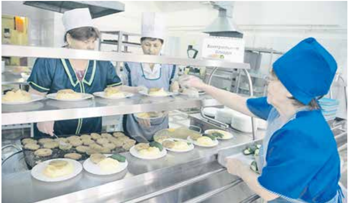
За питанием детей требуется особый контроль.

В школьных столовых нарушают санитарные требования