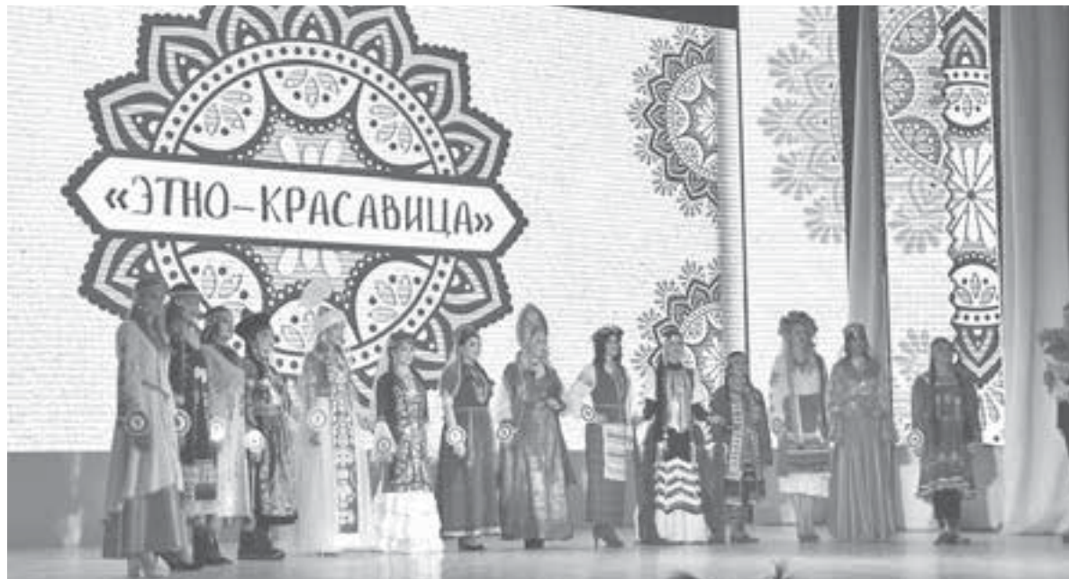
К конкурсу участницы готовились полтора месяца.