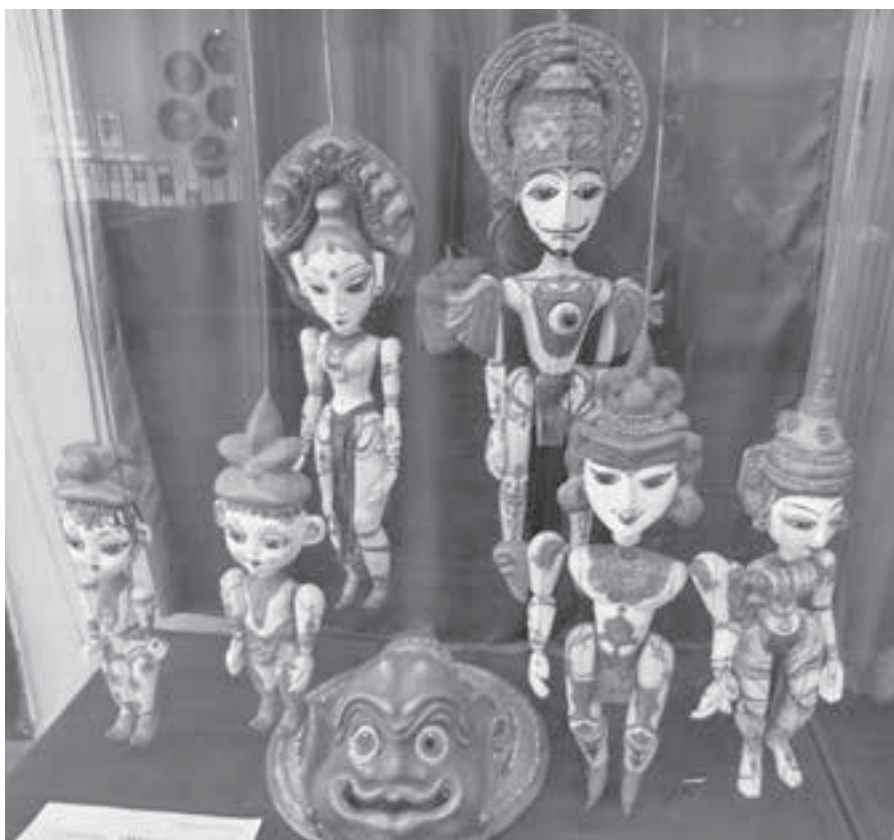
К куклам надо привыкнуть...

Порой мы прибегаем к уже проверенным годами приёмам, но абсолютных повторений, конечно, нет. Я думаю, что если однажды нами был использован удачный стиль, а через какое-то время ставится пьеса, к которой он подходит, то поче-