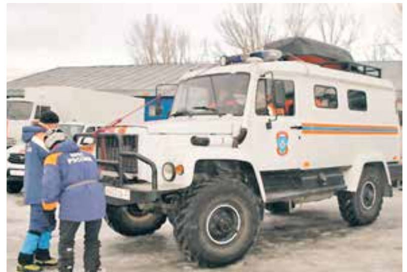
Спасатели выехали на автомобиле повышенной проходимости.

«На выручку туристам отправились три сотрудника краевого