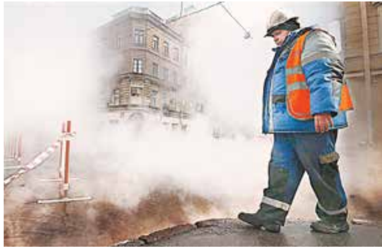
В Петербурге мошенники из бюджета брали деньги на новые трубы, а закапывали в землю старые. Вот они и рвутся.

Почему по всей стране рвутся трубы, и люди сидят без тепла?