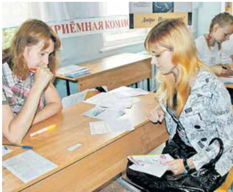
В камчатских вузах нет некоторых популярных сегодня у молодёжи специальностей.

Министр образования и науки России Ольга Васильева в одном из интервью прошлого года заявила, что в московских вузах учится всего 30 % москвичей, остальные – приезжие. По данным краевого министерства образования и молодёжной политики уезжают учиться на материк около 60–65 % выпускников камчатских школ. Мечта стать студентом престижного