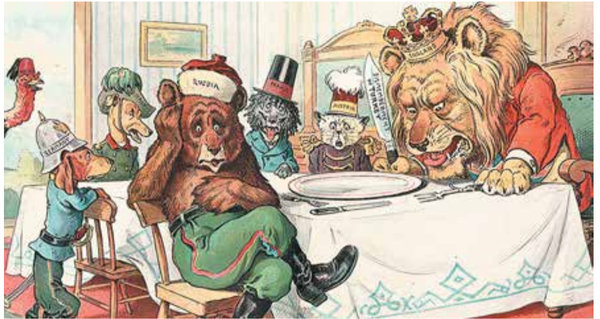
В начале XX века англосаксы так же делили мир, в котором России доставалась пустая тарелка. Карикатура из американского журнала Ruck («Шалун»).

Но я надеюсь, что всё-таки победит разум. Они должны смириться с тем, что мир уже не