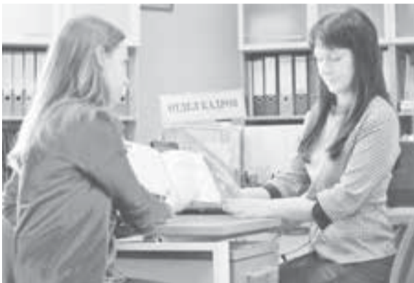
Требуются высококвалифицированные кадры.

Обучение носит интенсивный и, как правило, краткосрочный характер. Его продолжительность устанавливается образовательными организациями и не превышает 6 месяцев. Продолжительность зависит от вида обучения. Это может быть подготовка, переподготовка, повышение квалификации. Сейчас средний период обучения составляет 2,5 месяца. Более длительный период обучения проходит по программам про-