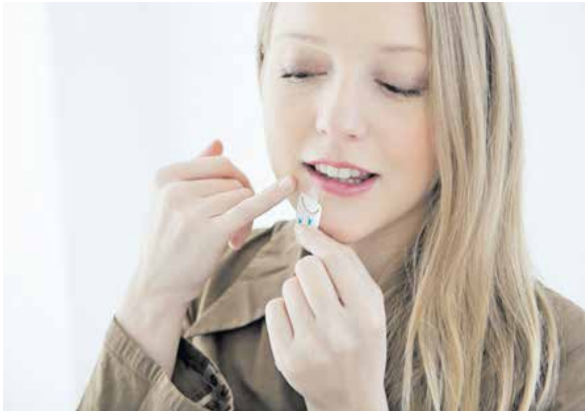
Лечить герпес нужно начинать сразу.

А вот простой вирус второго типа – генитальный герпес, передаётся только половым путём, и человек считается заразным, даже если у него отсутствуют симптомы болезни. Таких людей называют вирусоносителями – они сами не болеют, но