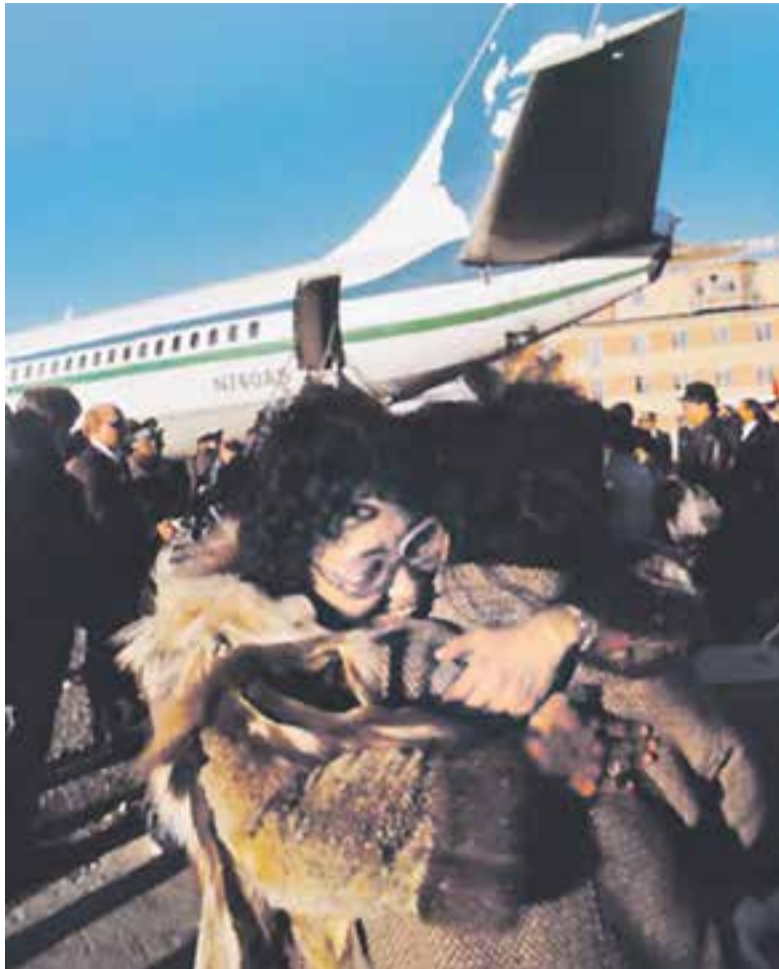
Родных не видели 40 лет.

— Как и для любого автора для меня важно, чтобы книга легко читалась. Но при этом я не перевирал факты. Да, в ней присутствует субъективизм, потому что во время работы над книгой были проинтервьюированы около ста человек — очевидцев этой истории, и все