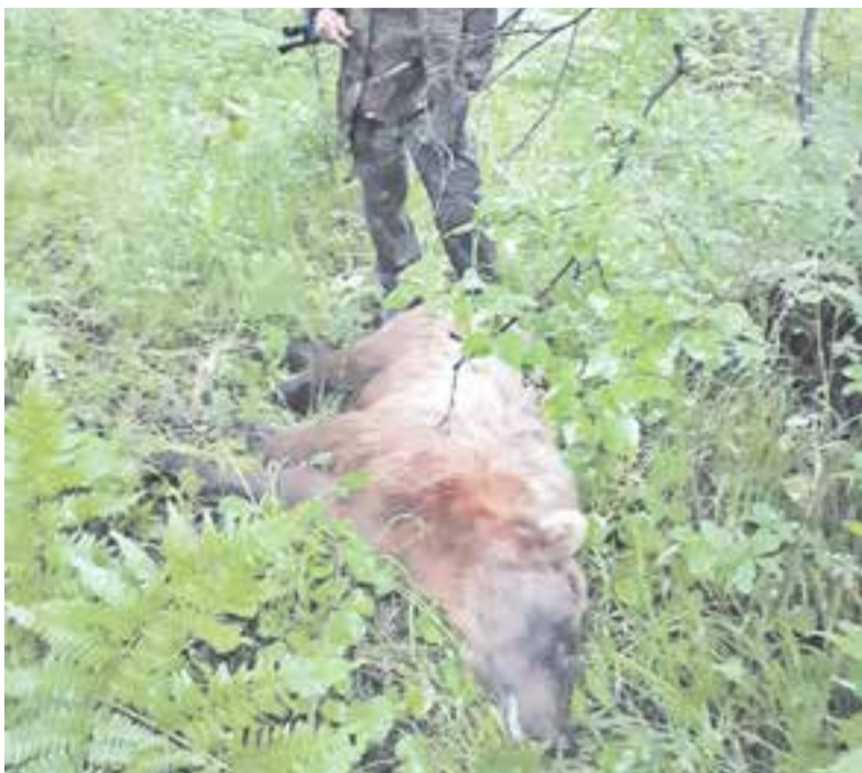
Охотники выследили хищника рано утром.