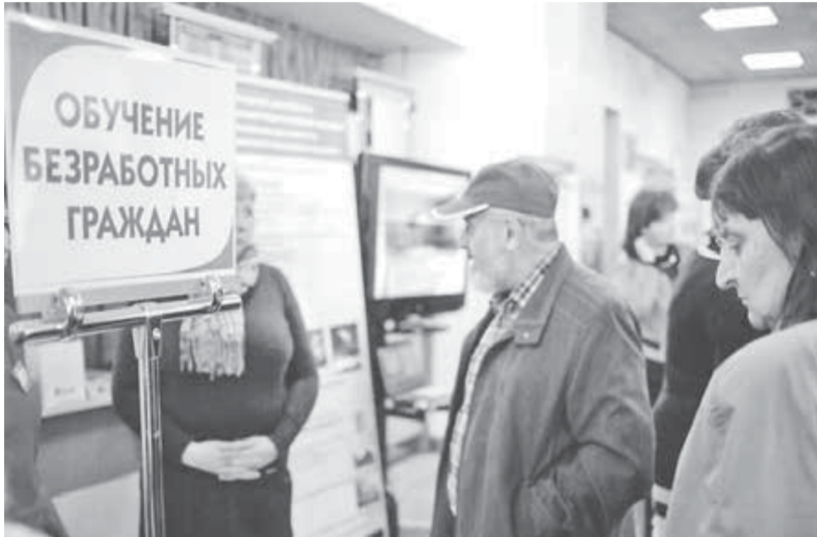
Специалисты службы занятости помогут выбрать подходящую профессию.

Такое право имеют граждане, признанные в установленном порядке безработными, в том случае, если: он не имеет профессии (специальности); невозможно подобрать подходящую работу из-за отсутствия у соискателя необходимой квалификации; гражданину необходимо изменить профессию (род занятий) в связи с отсутствием работы по его квалификации, а также, если утрачена способность к выполнению работы по имеющейся специальности.