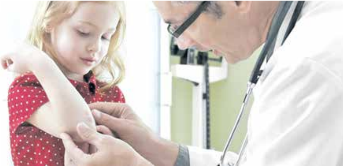
Псориаз встречается и у детей.

На точность указанных сведений сильно влияет тот факт, что значительное число больных не обращаются к врачам.