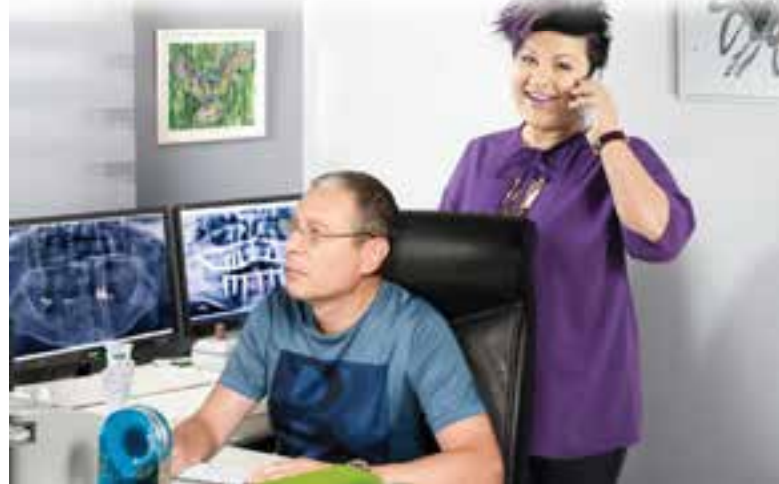
Безнадёжных случаев в нашей сфере практически не осталось.

Другая красноречивая история приключилась с женщиной, чей супруг даже не догадывался, что она давно сменила настоящие зубы на съёмные. Поскольку протез порой может утомить, в любой подходящий момент женщина была рада от него избавиться. И вот однажды, когда супруг был в командировке, а белоснежная «улыбка» лежала на прикроватной тумбочке, её хозяйка погрузилась в дрему. Вдруг дверь в квартиру начали настойчиво