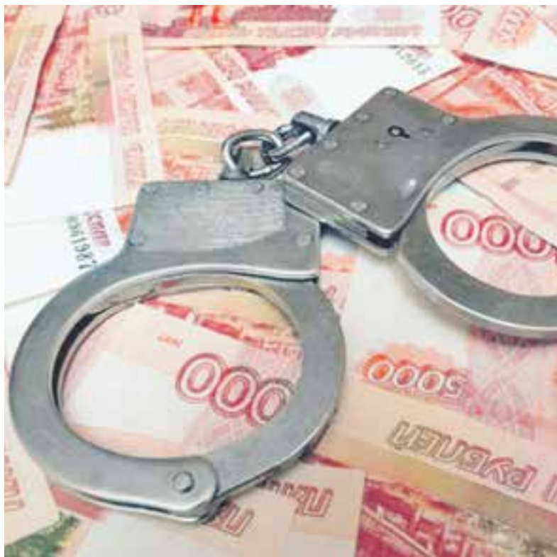
Бывшему руководителю грозит большой срок.

Действия обвиняемого повлекли причинение существенного вреда правам и законным интересам работников ОАО «Камчатавтодор», самого акционерного общества, а так-