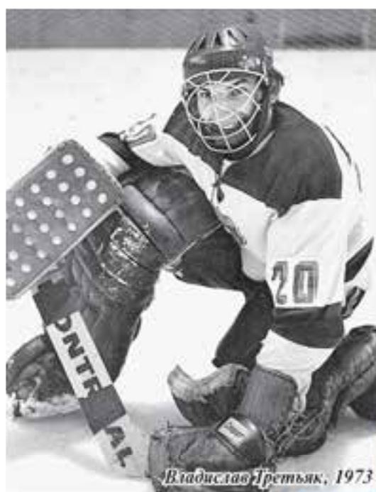
Владислав Третьяк, 1973

- Это стало бы для меня большим потрясением. Но трагедия? Позор? Не уверен, что эти слова подходят в данном случае. Можно ли назвать позором олимпийское «серебро»? Вот канадцы взяли «бронзу» и