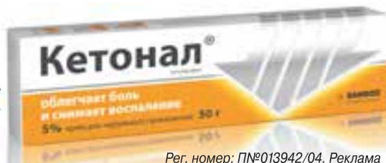
Рег. номер: ПН№013942/04. Реклама

Не забывайте о дачном «транспорте» - тоже отличная помощь спине.