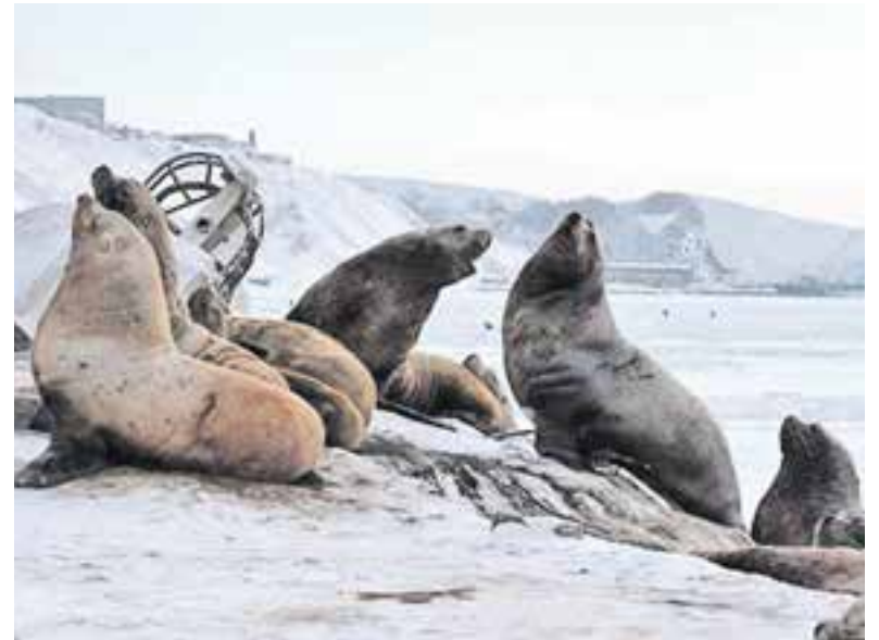
Сивучи нуждаются в защите.

Что касается сохранения сивучей, которых с каждым годом становится всё меньше на залёжках в Петропавловске, то главная проблема остаётся в несознательном поведении горожан. Они кормят животных мороженой рыбой, чего категорически нельзя делать, пугают их, кидают камни, петарды и прочее. Природоохранные организации могут добиться ограждения залёжек (как это уже сделано на пирсе на Моховой), позаботиться, чтобы были убраны куски арматуры или металла,