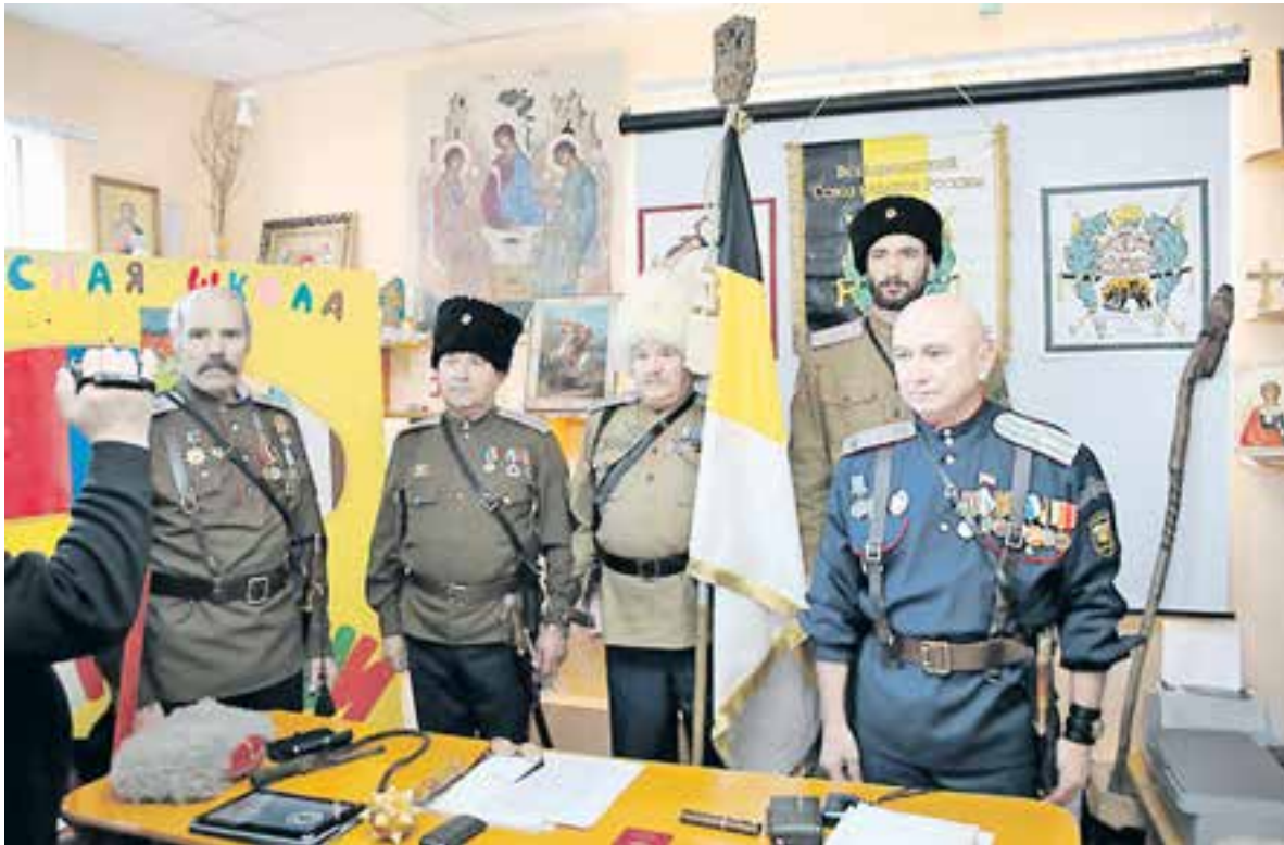
«Союз казаков России — наша «альма-матер».