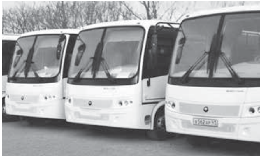
Новых автобусов в городе мало.

Суд признал недействительным конкурс на пассажирские перевозки