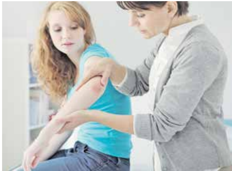
Больным необходимо регулярно ухаживать за кожей.

Ещё один миф, что псориаз обязательно передаётся по на-