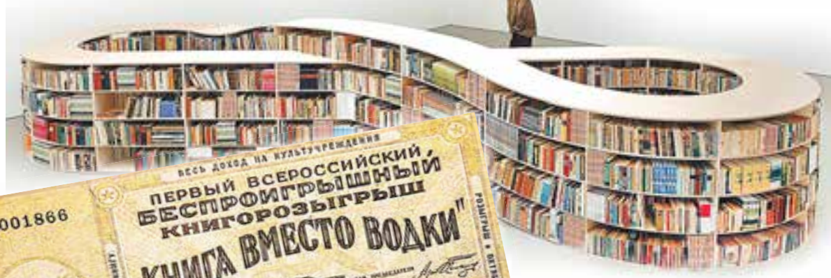
Любовь к чтению в разные времена воспитывали по-разному: и через такие лотереи, и превращая библиотеки в арт-объекты.

Мы практически весь прошлый год читали, спорили, снимали фильмы, проводили конференции и выставки с единственной целью: разобраться, чем же стала для России Октябрьская революция. Звучала фраза «Надо извлечь уроки из истории». Но никак не примирения достигнуто не было - достаточно вспомнить скандал вокруг