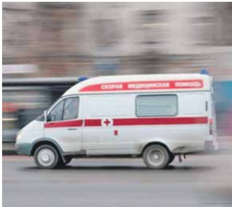
На «линии» работают 16 бригад.

— Оно со временем сменялось на более профессиональное чувство — эмпатию — осознанному сопереживанию текущего эмоционального состояния другого человека без потери внешнего происхождения этого переживания. Ну много будет толку, если я начну голосить