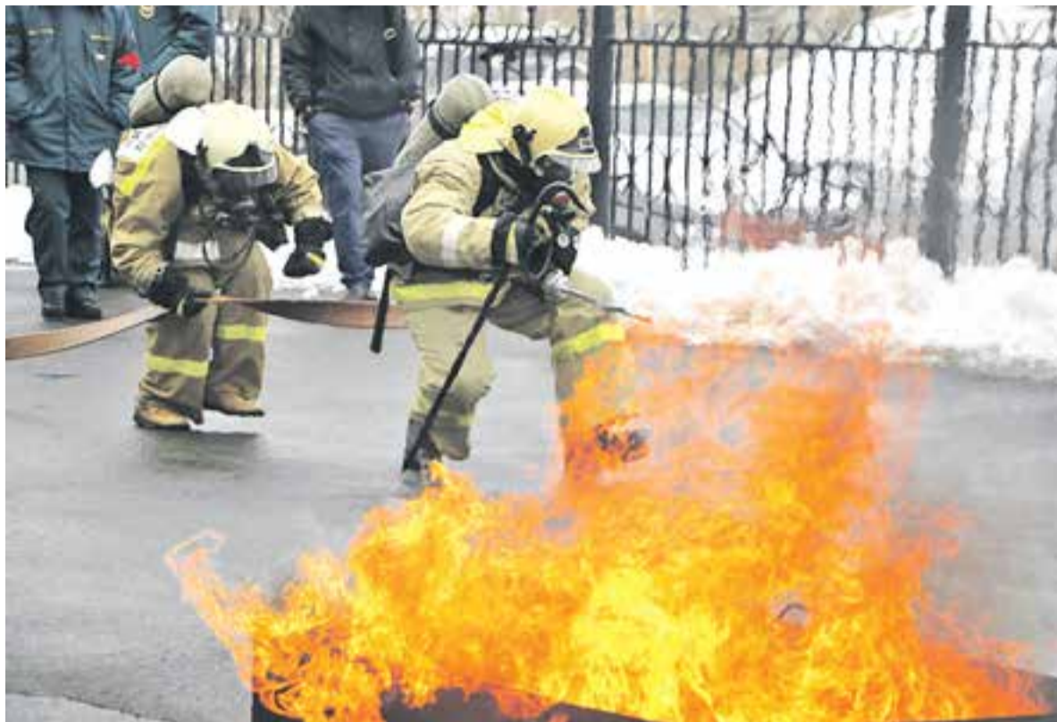
Пожарным спортсменам есть что показать.