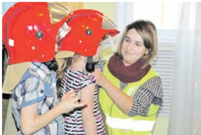
Пожарной безопасности детей нужно обучать с малых лет.

Вообще, Камчатка в этом смысле регион особенный –