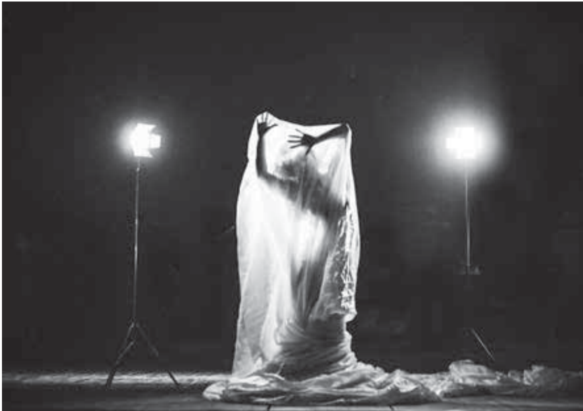
О чём шепчет танец?

высокого уровня, нас с удовольствием приглашали.