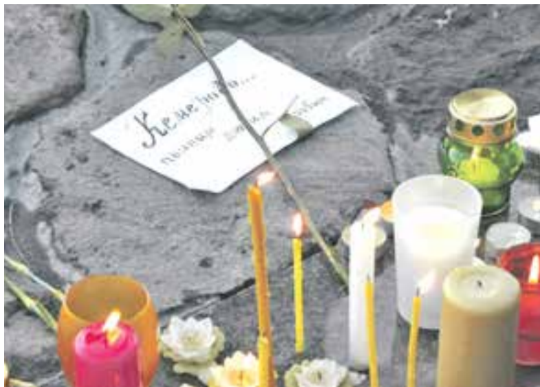
Камчатцы скорбят вместе со всей страной.

мир за несколько часов. Масла в огонь подлили пользователи соцсетей, которые прикрепляли к этим сообщениям фотографии обгоревших жертв других трагедий. И миллионы людей читали эти сообщения, ужасались фото, бесконечно им верили и...передавали по цепочке своим знакомым.