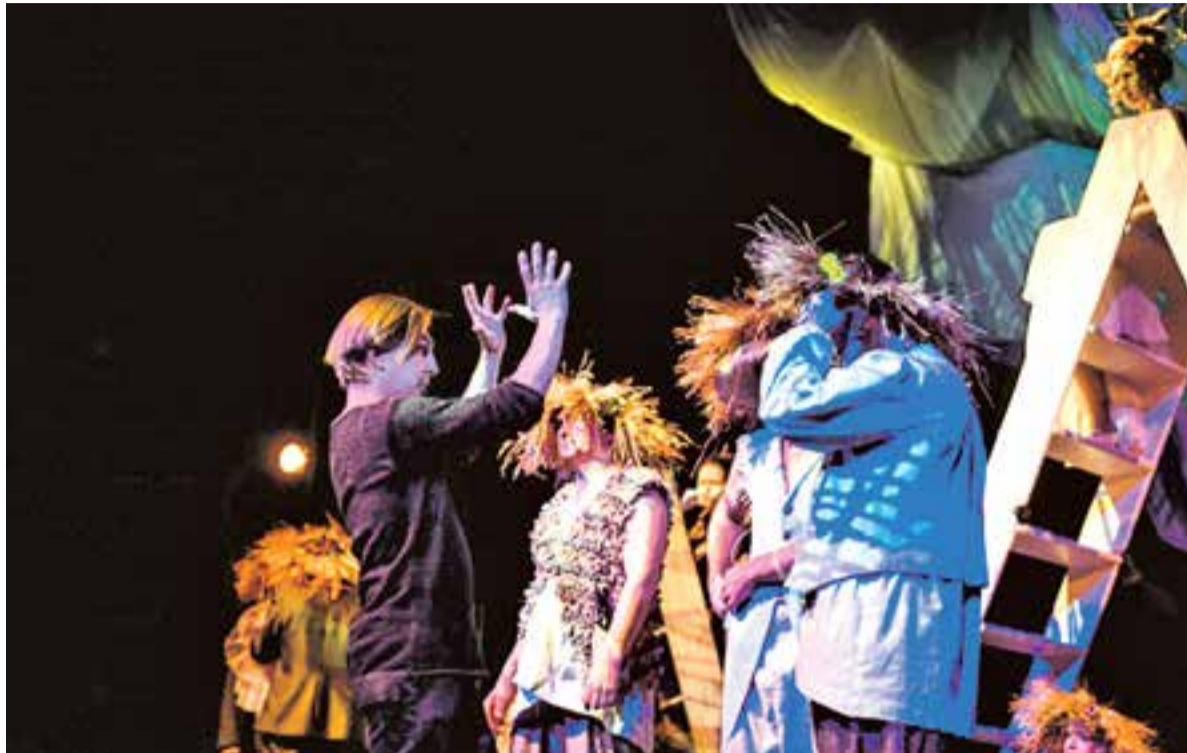
«На Камчатке фантастическая труппа».

Мы репетировали на малой сцене, пространство было готово за месяц до премьеры, и была возможность «поиграться» долго со всем, что в спектакле будет, а это для меня очень важно. Пока спектакль не обретёт «домик», в котором он заживёт, я его «не слышу», нет отправных точек, на которые можно опереться. То, что намечено в эскизе, не обязательно появится на сцене в таком же виде: это как письмо незнакомому человеку — что он из него поймёт, заранее неизвестно. Словом, я увлёкся, а конкурс на место постоянного режиссёра как-то отошёл на задний план... После «Дамы с собачкой» я предложил сделать «Дуру» и почти одновременно с ней — «Клятвенных дев». Об этой пьесе мечтал с тех пор, как она появилась в 2014