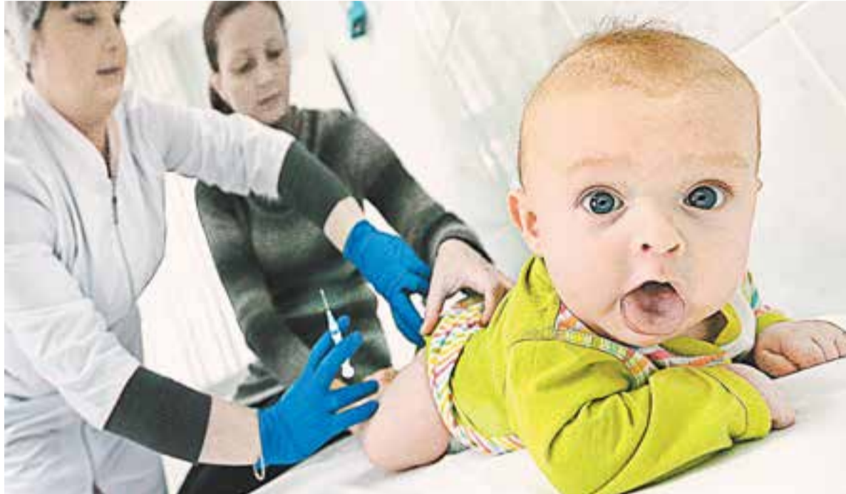
В Австралии родителей непривитых детей лишают пособий, а у нас любой врач может безнаказанно отговаривать от вакцинации.