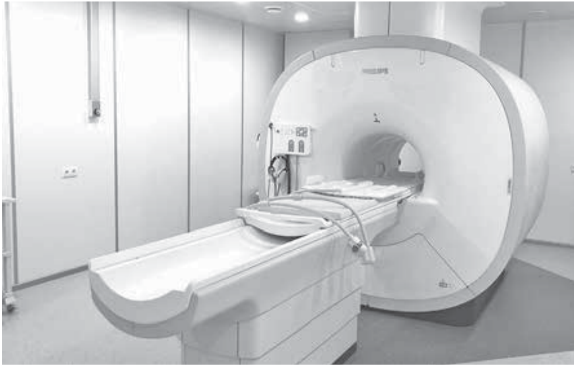
Не все пациенты подходят по габаритам.

Почему обследование на аппарате МРТ могут пройти не все