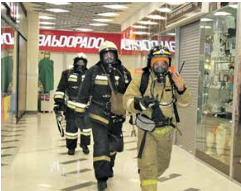
Пожарные регулярно проводят тренировки в торговых центрах.

– На сегодняшний день в крае проверены наиболее крупные объекты, такие как торгово-развлекательные центры «Шамса», «Планета», «Пирамида», торговые центры «Евразия», «Европейский», магазин «Детский мир», Дворец детского творчества в Петропавловске-Камчатском, торго-