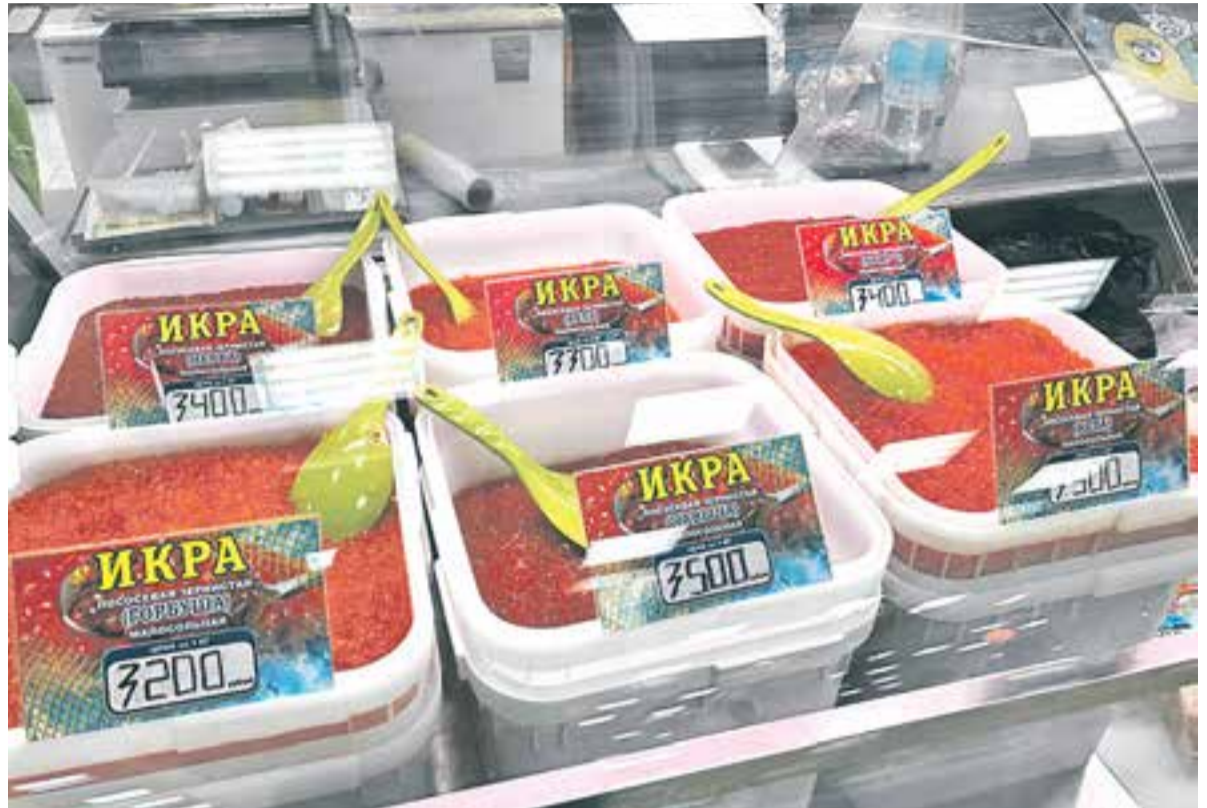
Камчатцы поедают икру не ложками, а глазами.

За год больше всего подорожали икра, рыба, водка и табак