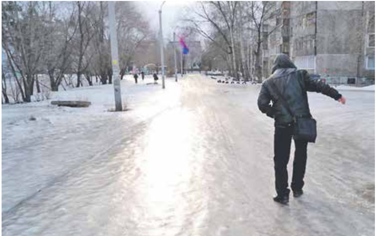
Не стоит надеяться на русский авось.