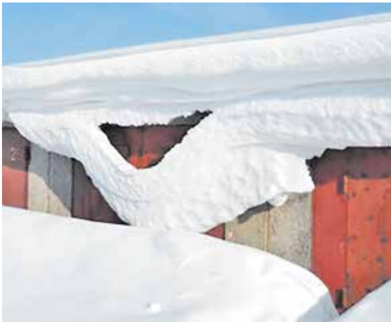
К нерадивым собственникам примут меры.