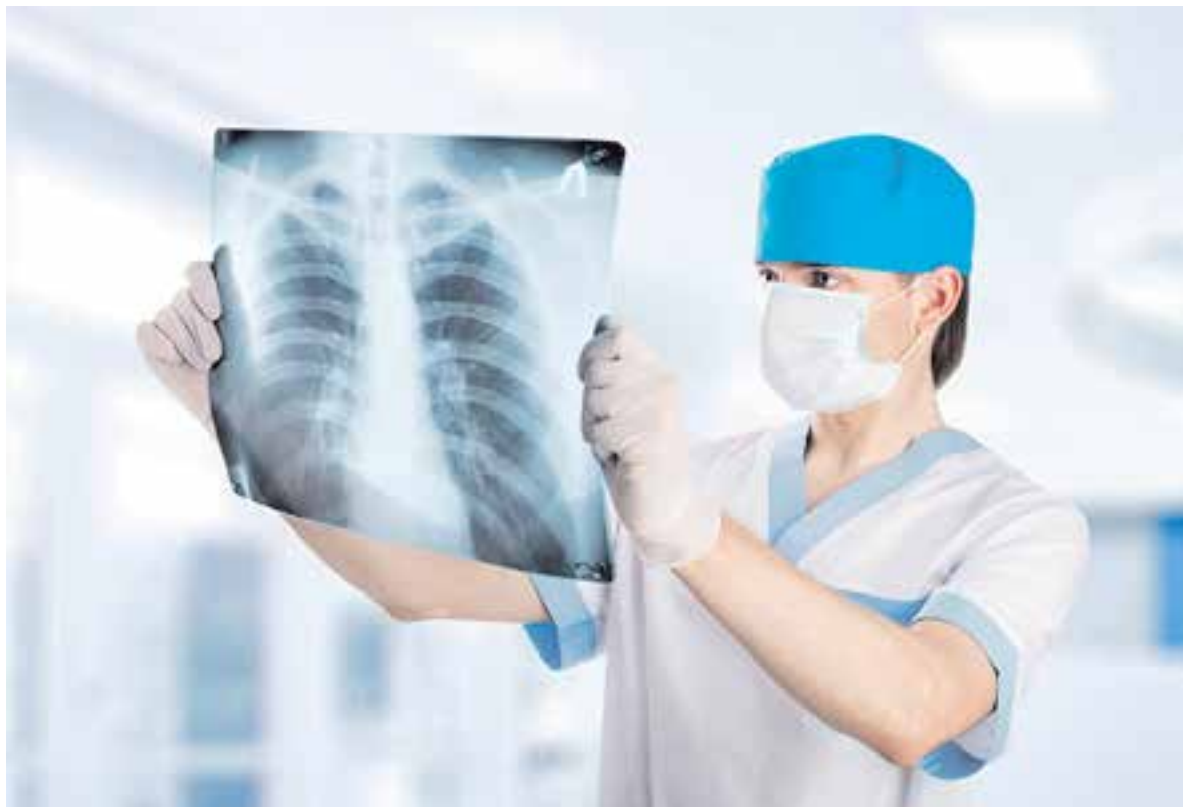
Флюорографию необходимо делать каждый год.

Действительно, микобактериями туберкулёза инфицированы миллиарды людей,