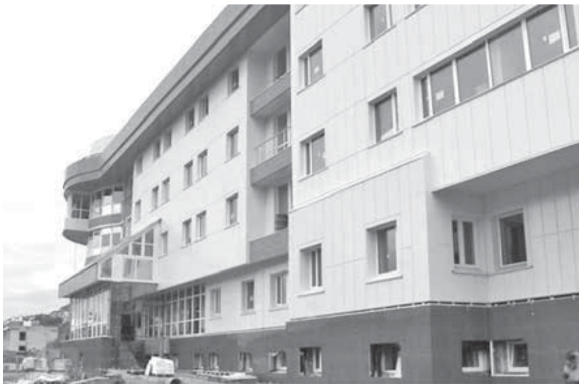
В крае строятся современные медучреждения.

Сегодня, к счастью, ситуация изменилась. Камчатка стала более благоприятна для жизни. Многие дети, молодёжь, уезжать не хотят. Например, мой сын – никуда не хочет и ни за что не уедет.