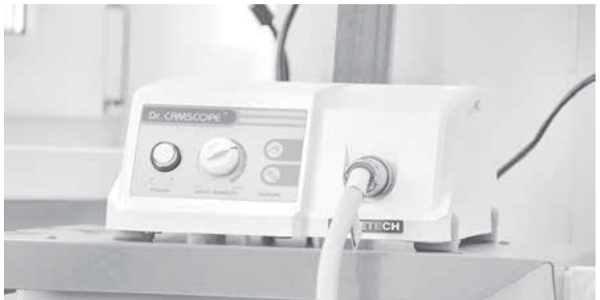
В больницы закупают новое оборудование.

С утра до вечера в кабинет главного врача шли врачи, медсёстры, нянечки с детьми на руках, просили, чтобы им выдали хоть что-нибудь на пропитание... Бастовать врачи не могли, мера ответственности гораздо выше, чем в других профессиях, и я убеждён, что в те годы медицина страдала больше всех. Это действительно была страшная катастрофа.