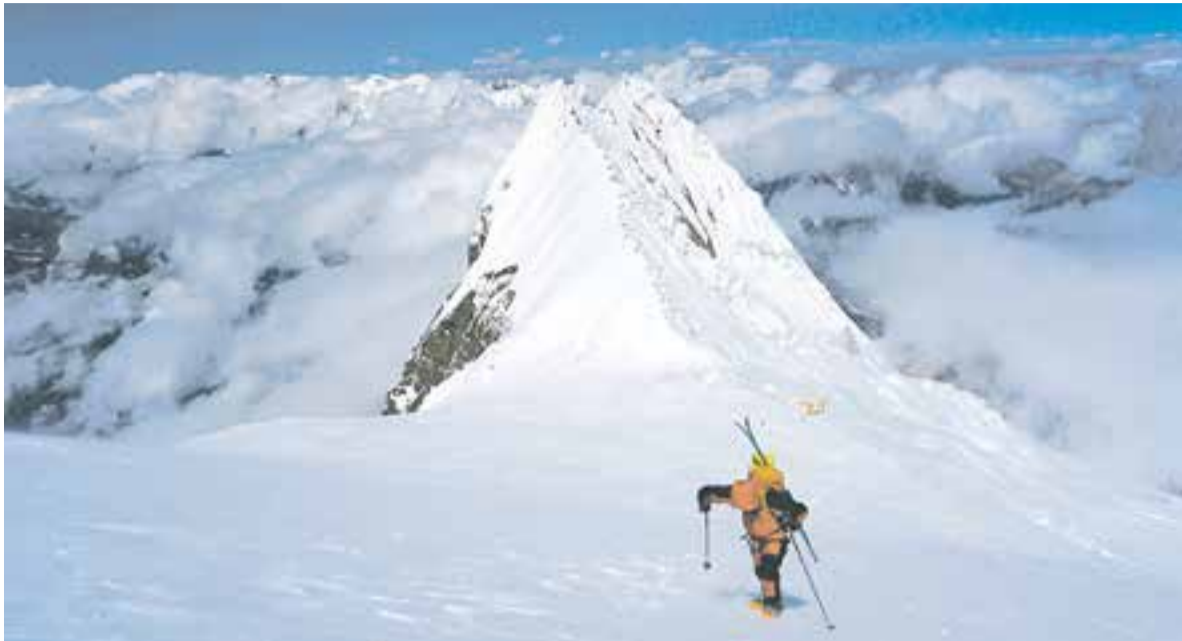
Восьмитысячники – для подготовленных альпинистов.