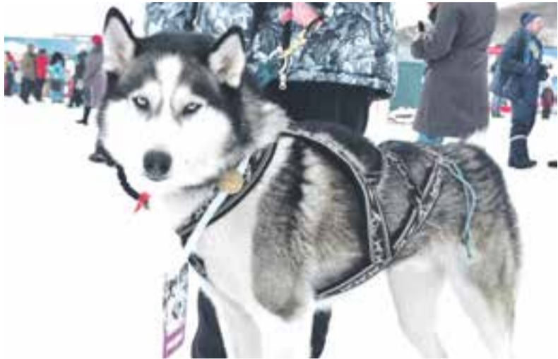
Звездой праздника стала хаски.

Жителям Петропавловска приглянулся «Снежный путь»