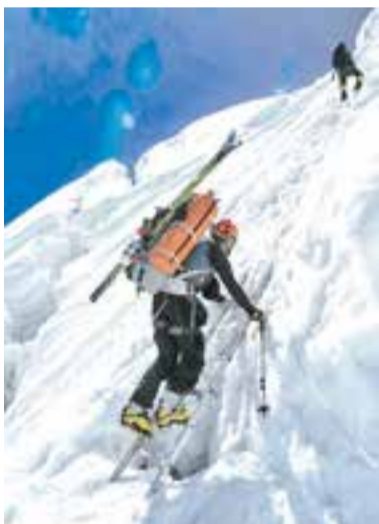
В горы – с лыжами.

как раз, было наоборот. Знаете, когда человек голодный, если дать ему немножко еды – он любой крошке будет рад. А если его постоянно кормить деликатесами – то это уже не деликатесы вовсе.