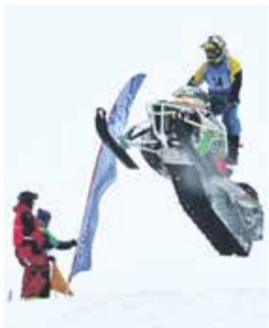
Полёт на снегоходе.

ки, что придало соревнованиям ещё больше пикантности. Среди участников было большинство водителей на иномарках, но активнее всего болельщики поддерживали владельца «Нивы».