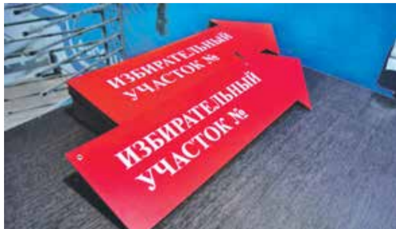
Раньше явка составляла более 90 процентов.

Подобная акция впервые пройдёт на Камчатке, и она преследует сразу несколько целей. Во-первых, помочь ребятам лучше понять себя и свои