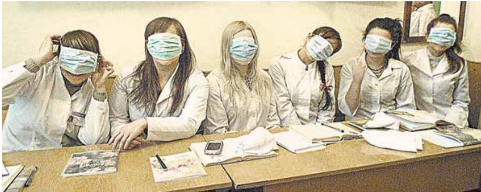
Нужно ли бояться людей в масках?

Как обманывают пациентов в негосударственных клиниках