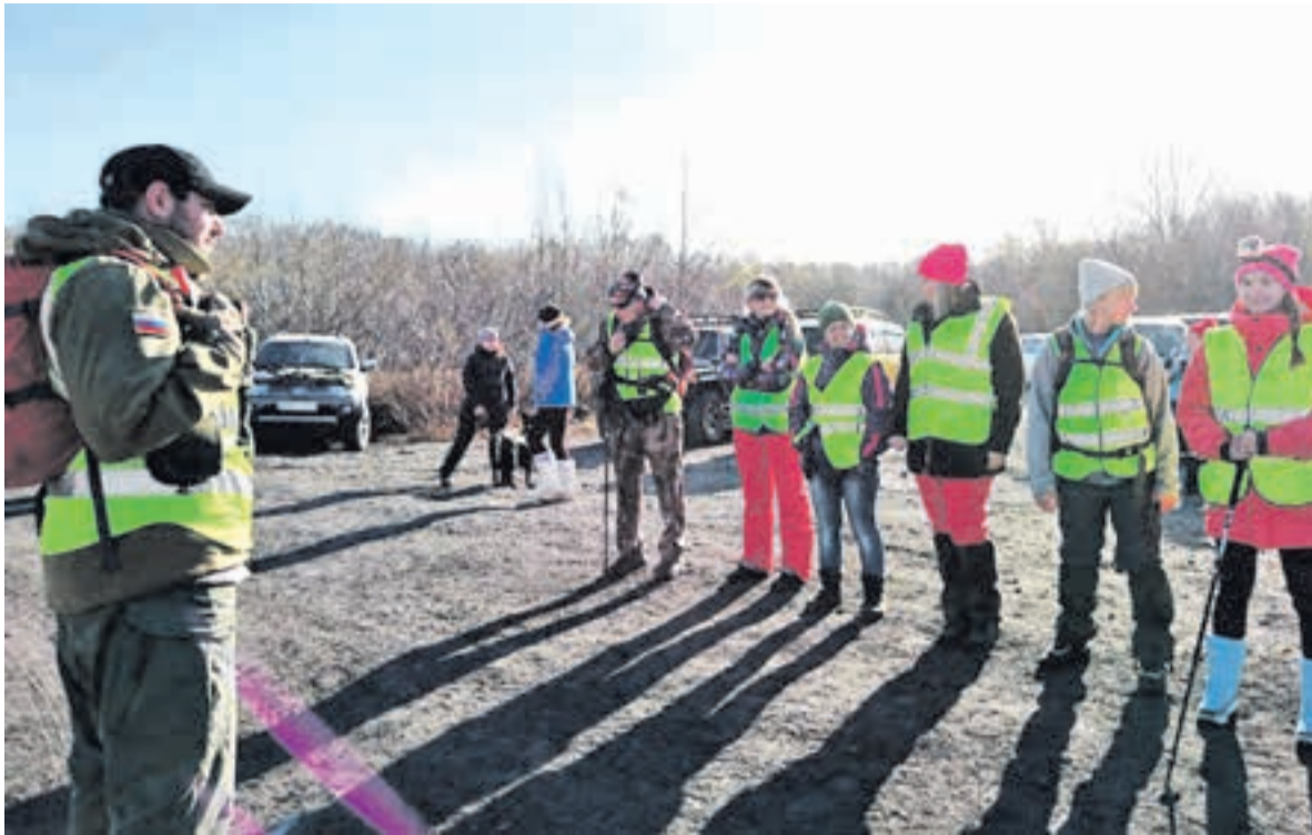
Волонтеры выходят на поиск.

данами, когда люди начинают впадать в крайности и обвинять их в «непрофессионализме». Но этого никто не видит и не замечает.