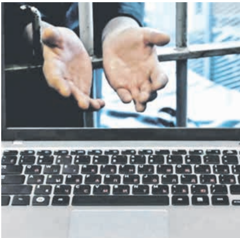
Недостающую технику пришлось купить подчинённым.

Напомним, первое уголовное дело в отношении генерала связано со строительством объекта «База авиационного отряда специального назначения в г. Петропавловске-Камчатском». Между Отделом организации капитального строительства УМВД по Камчатскому краю и ООО «КамчатПроект» был заключён государственный контракт на выполнение изыскательских и проектных работ. Согласно графику, подрядчик должен был сдать работу через 16 месяцев — в ноябре 2010 года. Планировалось, что сам