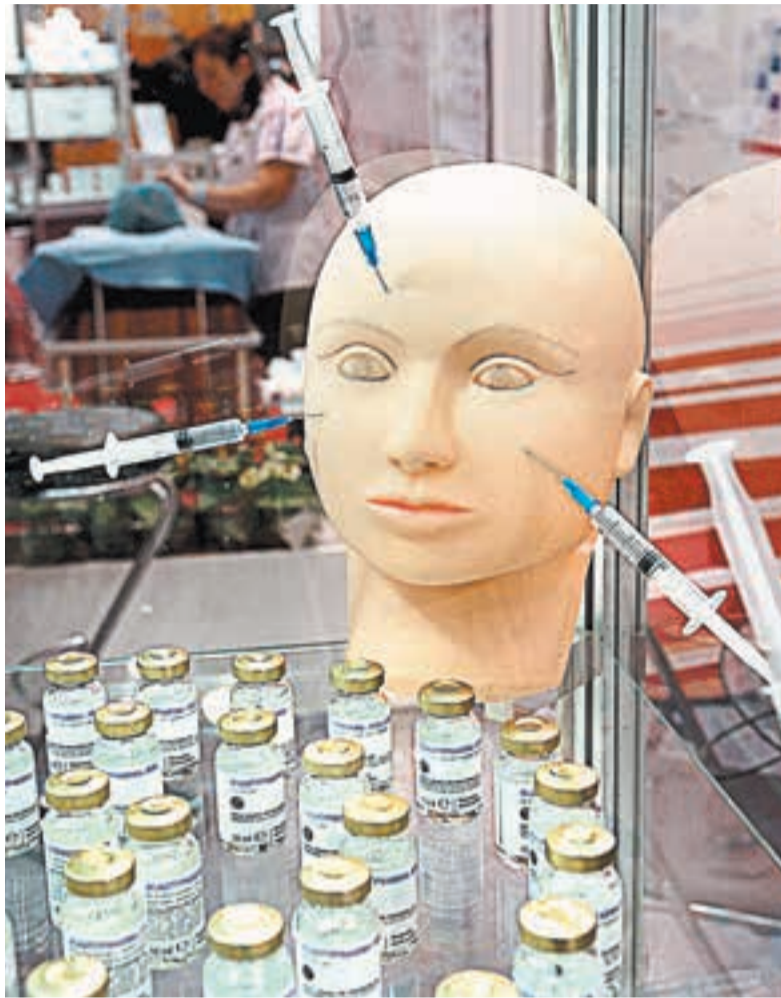
Медики пока ещё сами не научились понимать, кому терапия стволовыми клетками впрок, а кому - нет.

Удивительно, но след такого лечения прослеживается и во многих других трагических смертях известных актёров - Любови Полищук в 2006 г., Александра Абдулова в 2008-м, Олега Янковского в 2009-м, Анны Самохиной в 2010-м, Жанны Фриске в 2015-м. Список можно продолжать, в нём есть спортсмены, политики и другие публичные люди. Все они были успешными, красивыми, далеко не старыми. А если кто и