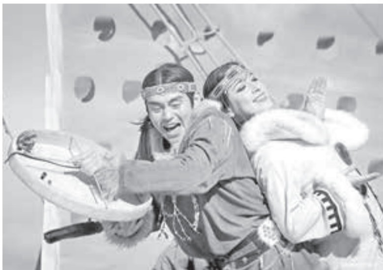
«В маленьких посёлках живёт наш зритель».

– Многие завидуют творческим личностям, реализовавшим себя в любимом деле – ведь такая работа, как у тебя, похожа на сказку: танцуй, путешествуй, каждый день праздник. Но у любой медали бывает обратная сторона. Что на ней?