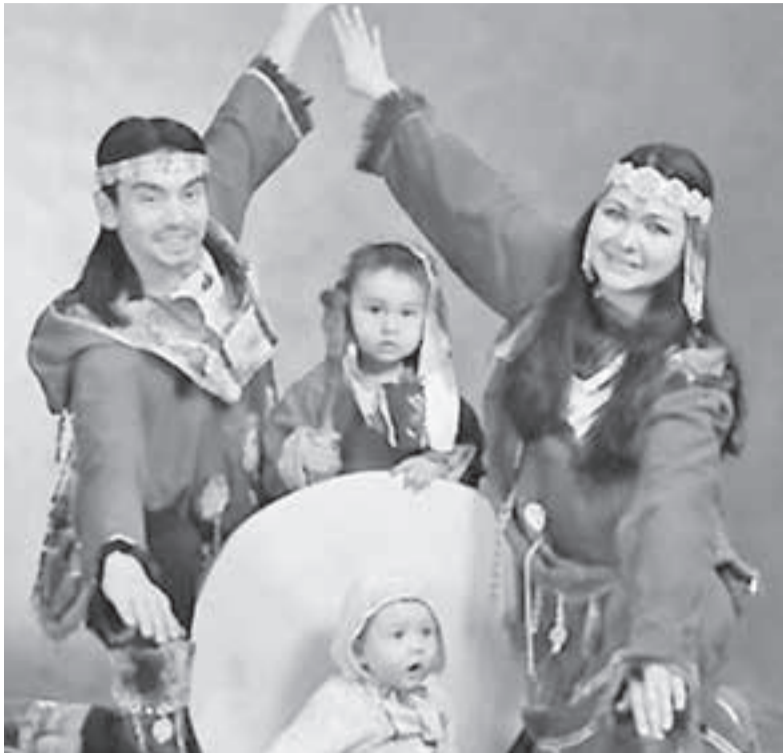
Семья Падериных в сборе.

А первые настоящие праздничные платья сшил для соседских девочек. Мы тогда уже переехали в Петропавловск, мне было лет 12. Жили и мы, и соседи, и многие тогда очень скромно, и мне захотелось порадовать детей к Новому году. Я нашёл какие-то лоскуты, куски ткани и сшил девочкам платья, юбки, даже шляпу какую-то соорудил – всё по моде. Сюрприз удался, дети были в восторге. И так вышло, что много лет спустя их мама, наша бывшая соседка,