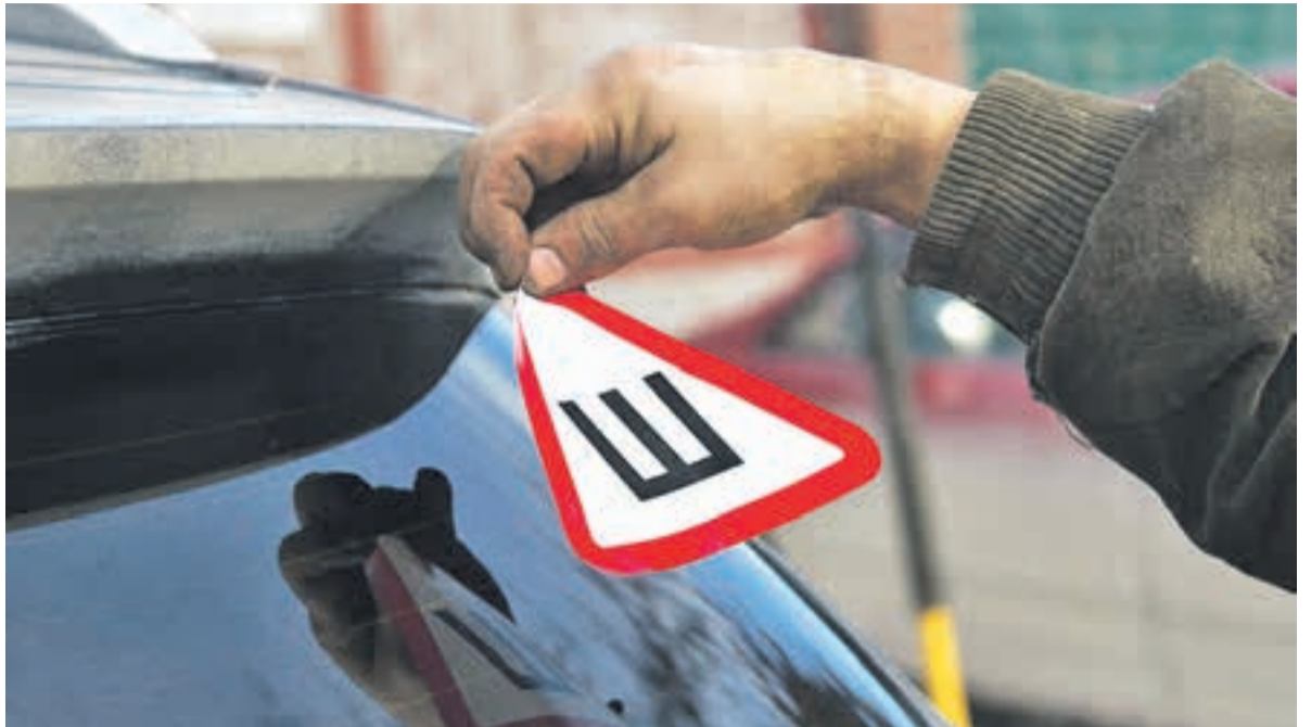
Забывчивые лишатся денег.

Какие законодательные новшества принёс декабрь